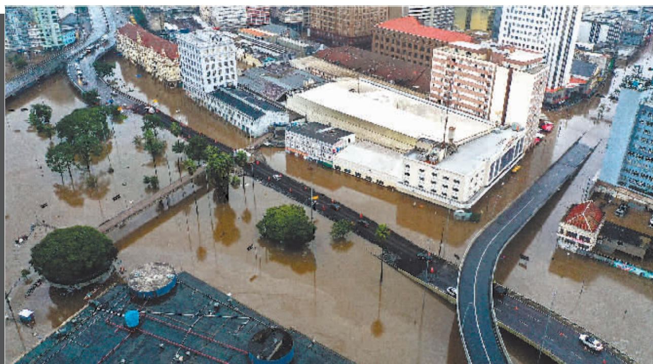
这是5月11日在巴西南里奥格兰德州阿雷格里港拍摄的受洪水影响的区域。

在巴西,一些低收入者住在用木材搭建的房子里,这些房屋在极端天气下更容易受到破坏。