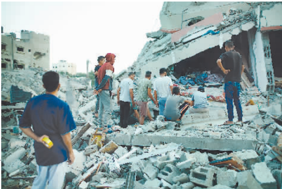
5月11日,在加沙地带中部迈加齐难民营,巴勒斯坦人查看以军轰炸后的废墟。

据巴勒斯坦加沙地带卫生部门12日发布的数据,以军过去24小时对加沙地带的袭击共造成63人死亡、114人受伤。去年10月新一轮巴以冲突爆发以来,以色列在加沙地带的军事行动已造成超过3.5万巴勒斯坦人死亡、超过7.8万人受伤。