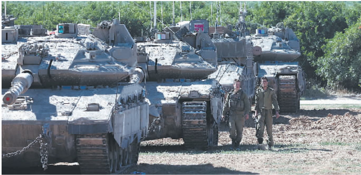
5月8日,以军装甲车在以色列南部凯雷姆沙洛姆口岸附近部署。

科医院所在区域也被列入疏散范围。除了这所医院,本地已没有其他地方能收治病患和伤员了。”他敦促国际社会立刻采取措施保护这家仅存的医疗机构。