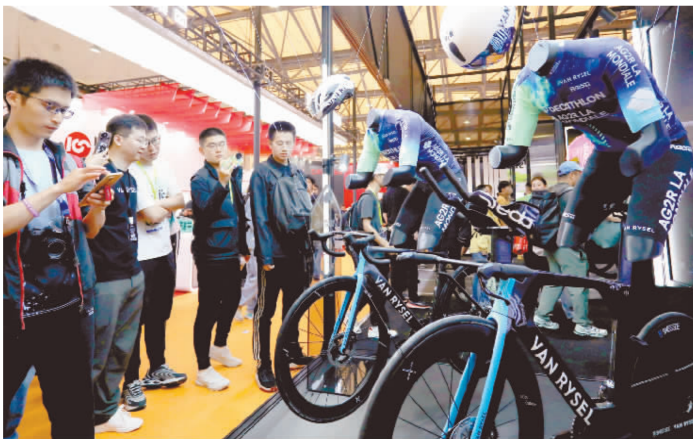
5月5日,在中国国际自行车展览会上,参观者在VAN RYSEL展台前驻足观看。