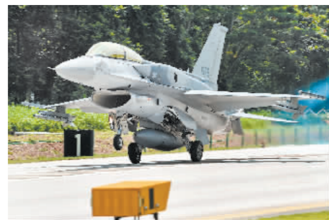
这是2016年11月12日在新加坡拍摄的新加坡空军F-16战机。

新华社新加坡5月8日电 新加坡国防部8日发布公告说,新加坡空军部队一架F-16战机当天中午在该国登加空军基地坠毁,飞行员弹射逃生。