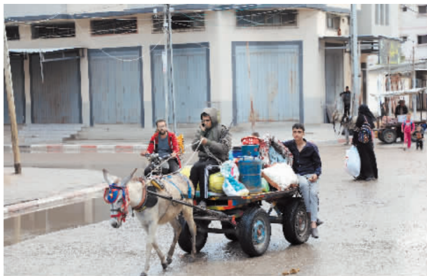
5月6日,在加沙地带,巴勒斯坦人离开家园。

哈马斯6日宣布同意斡旋方提出的加沙地带停火提议,但以色列方面表示哈马斯目前答应的条件与其要求相去甚远。以色列总理办公室6日晚发表声明说,以色列战时内阁一致决定继续在拉法展开行动,向哈马斯施加军事压力。以军7日发布战况通报说,以军地面部队6日夜间接对拉法口岸展开行动,已控制该口岸加沙地带一侧。