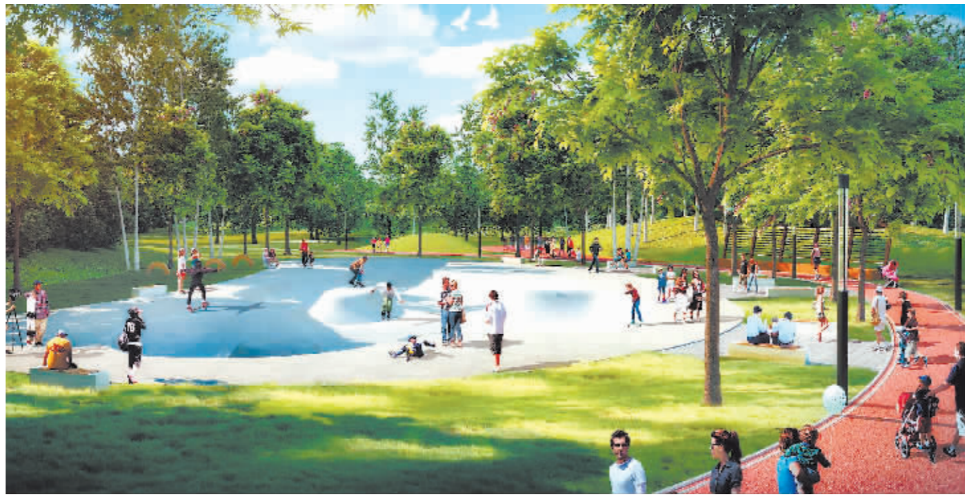
太阳岛绿色运动公园效果图。

在城市品质提升九大行动中,通过推进公园城市建设行动、交通便利出行行动、旧城改造更新行动、城市风貌提质行动、城市记忆传承行动、公共服务优化行动、市政设施保障行动、违建常态防控行动、治理能力提升行动,使城市面貌得到明显提升。