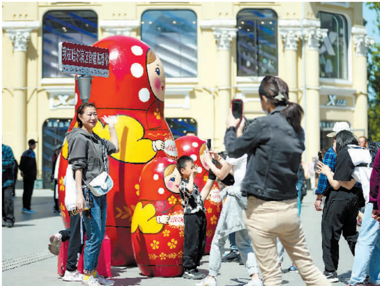
5月2日,游客在哈尔滨中央大街上留影。

五月的中华大地,山水如画,人潮涌动。街头巷尾,人气兴旺,烟火气中升腾火热消费;工地车间,繁忙有序,人们以昂扬之姿追逐奋斗梦想……这个假期,人流动起来、消费热起来、建设忙起来,处处展现中国经济强大活力和十足韧性。