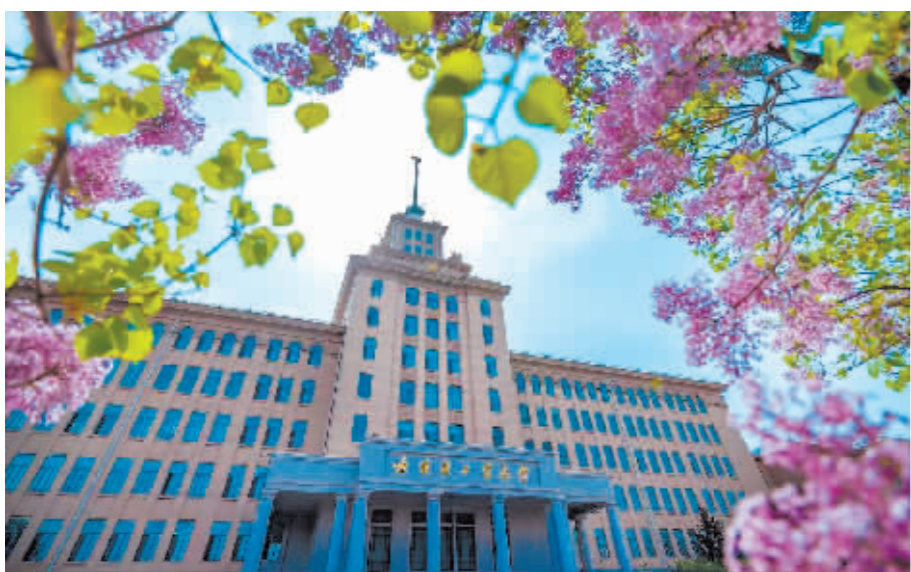
哈工大校园内丁香盛放。

本报讯(张又元 姜文卓 李梵楚 记者 纪天伟)悄然间,哈工大校园内的丁香花已缀满枝头。记者从哈尔滨工业大学了解到,今年,哈工大按照“丁香校园”总体规划铺设花路,推出“哈工大赏丁香攻略”4条专属路线,邀您打卡丁香花海。