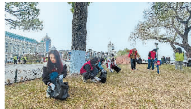
志愿者捡拾绿地内垃圾。

本报讯(张加勋 记者 刘殊媛)为助力打造宜居宜业新环境,切实改善沿江公园环境卫生状况,5月6日上午,道里区文明办、区园林局组织各街道19支志愿服务队180余人开展“共建文明城市 共享洁净道里”主题义务劳动活动。