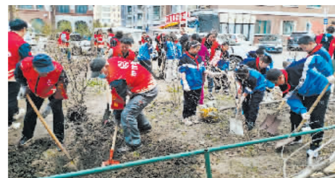
志愿者参加植树主题活动。

本报讯(李浩森 记者 杜菲菲)近日,道外区新一街道铸钢社区新时代文明实践站联合地铁物业、新一小学开展“青春志愿同行 共建绿色家园”主题活动。活动中,大家挥锹铲土、放苗扶正、填土压实、