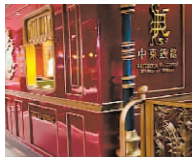
火车车厢主题餐厅。

“打造全新的博物馆历时10个月,从今年4月28日试营业开始,进店打卡的顾客就排起了长队。顾客在品尝非遗美食的同时,也在这里感受哈