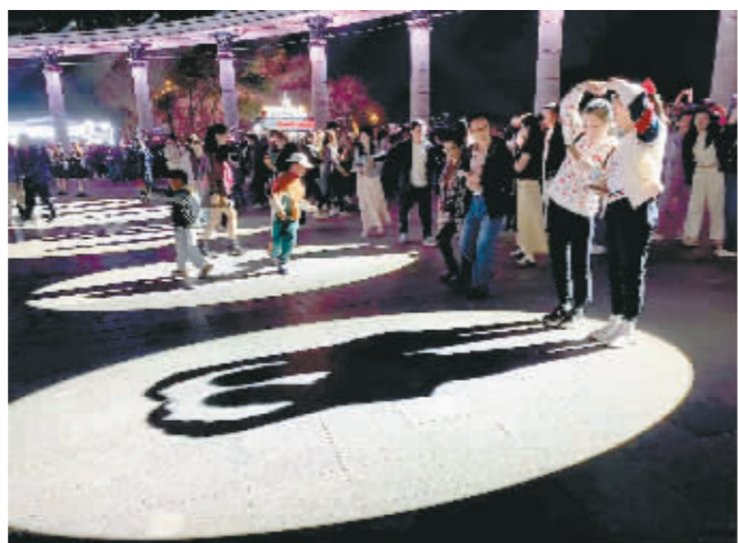
少男少女们在光影下玩起了影子游戏。