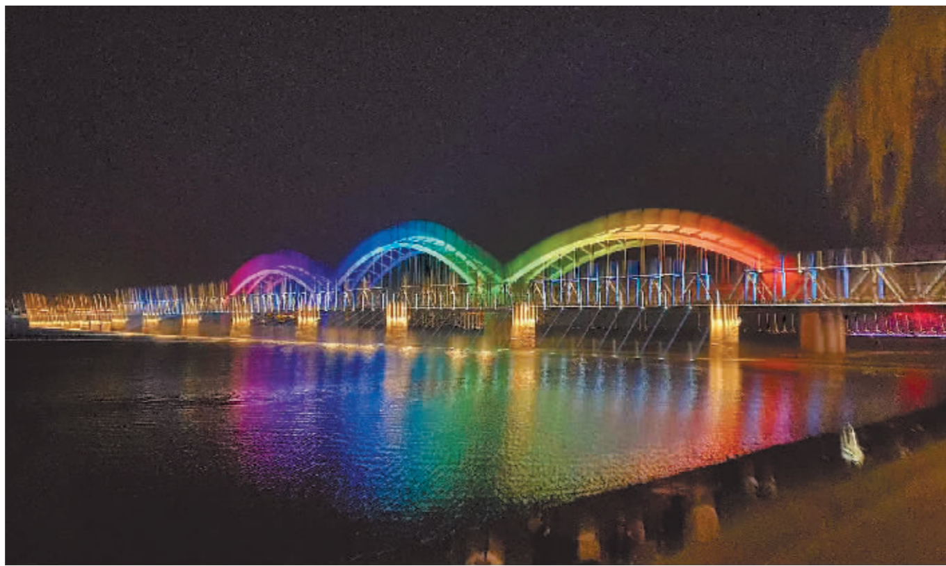
滨洲铁路桥变成彩虹桥。