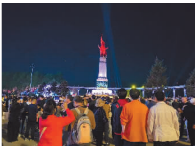
市民游客观赏“光影秀”。