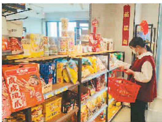
酒店增设新场景做出“差异化”。