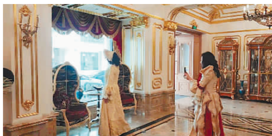
这家特色酒店主打“异国之旅”。