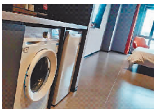
特色酒店满足游客的“生活需求”。