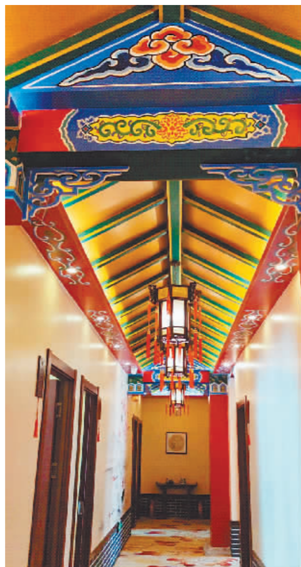
特色酒店处处是打卡景点。

住特色、得体验、享服务,感受城市魅力、品味独特文化……当下,特色酒店正在“酒店+”上做足文章,从单卖房间到卖“内容”晋级,满足游客不同需求,同时谋求开辟出文旅新赛道。