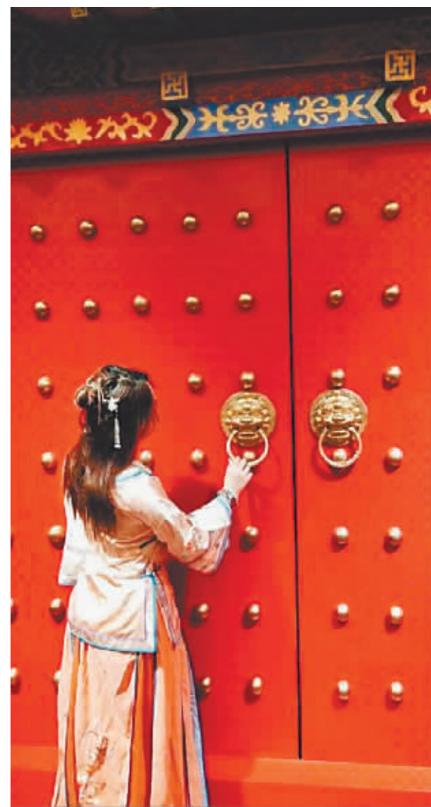
酒店特色设计让人“一秒穿越”。