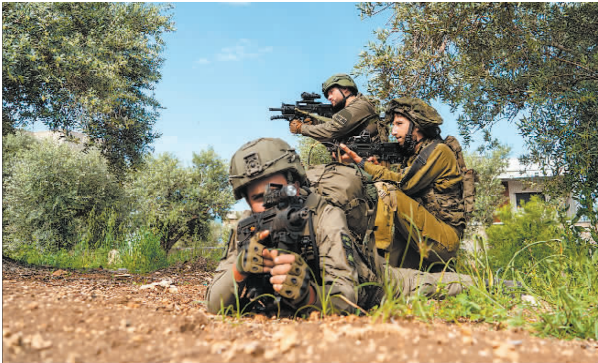
这张以色列国防军4月24日发布的照片显示,准备在加沙开展军事行动的以军预备役士兵在以色列一处地点训练。

据以方声明,以军在约旦河西岸城市杰宁附近一处检查站打死两名朝以军开火的巴勒斯坦男子。本轮巴以冲突爆发以来,约旦河西岸暴力冲突同样升级。据巴方卫生部门数据,超过490名巴勒斯坦人被以军打死。