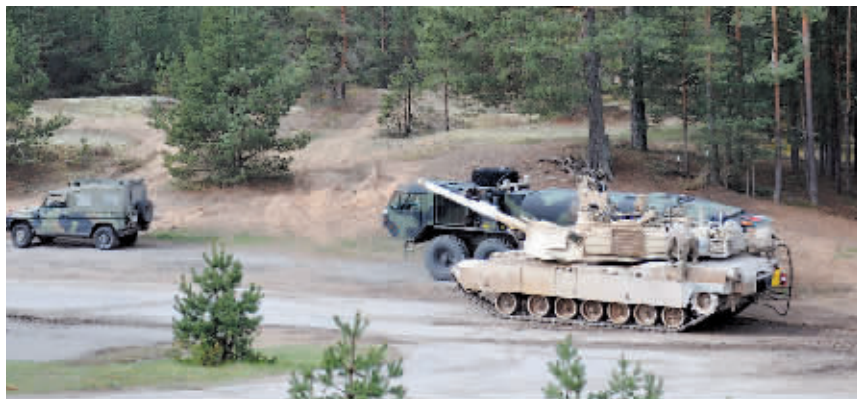
美军“艾布拉姆斯”M1A2主战坦克。

据新华社电 美国媒体25日披露,乌克兰已经把美国援助的“艾布拉姆斯”主战坦克撤出作战一线,原因是这种坦克频频成为俄军无人机的靶子。