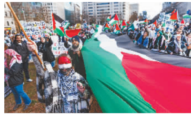
1月13日,在美国首都华盛顿,人们参加声援巴勒斯坦的集会游行活动。