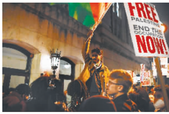
4月24日凌晨,抗议者在美国纽约市哥伦比亚大学参加示威活动。