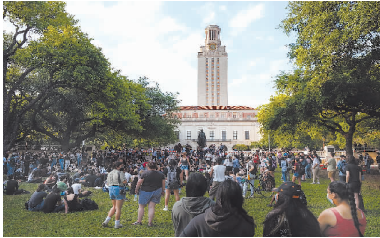
4月24日,人们在美国得克萨斯大学奥斯汀分校校园里举行集会。

美国多地高校反战示威活动在过去一周愈演愈烈,要求加沙地带永久停火、美国停止军援以色列。面对反战浪潮,总统拜登则在本周签署巨额对外援助拨款法案,向以色列提供更多军援。美国警方逮捕数百名抗议者。高校反战示威不断蔓延显示出美国年轻人对拜登加沙政策的不满与质疑,甚至被舆论认为可能影响其总统选举选情。