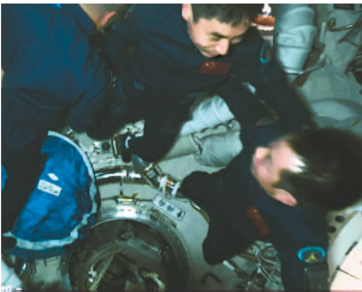
这是4月26日在北京航天飞行控制中心拍摄的神舟十七号航天员乘组欢迎神舟十八号航天员乘组的画面。