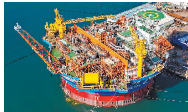
“海葵一号”浮式生产储卸油装置(FPSO)。