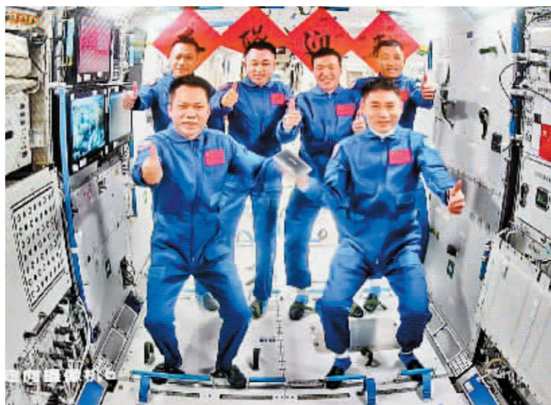
这是4月26日在北京航天飞行控制中心拍摄的神舟十七号航天员乘组和神舟十八号航天员乘组“全家福”。