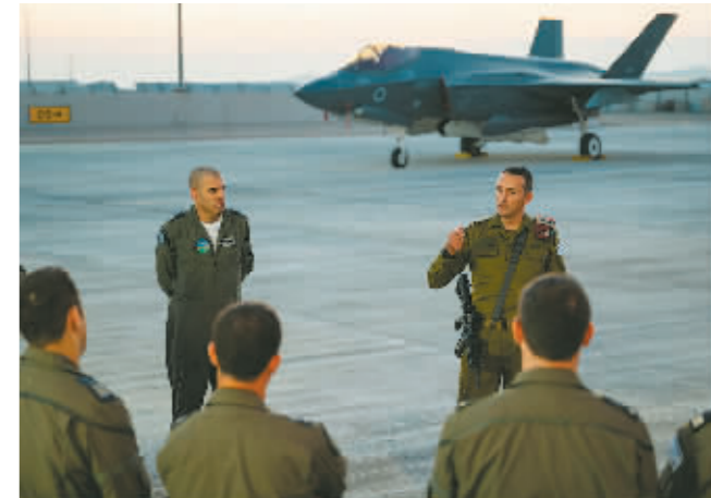
4月15日,以色列国防军总参谋长哈莱维(后右)在以色列南部的内瓦提姆空军基地讲话。

据新华社电 一名以色列高级防务官员24日说,以军已经准备好攻打加沙地带南部城市拉法,只等总理本雅明·内塔尼亚胡下达命令。