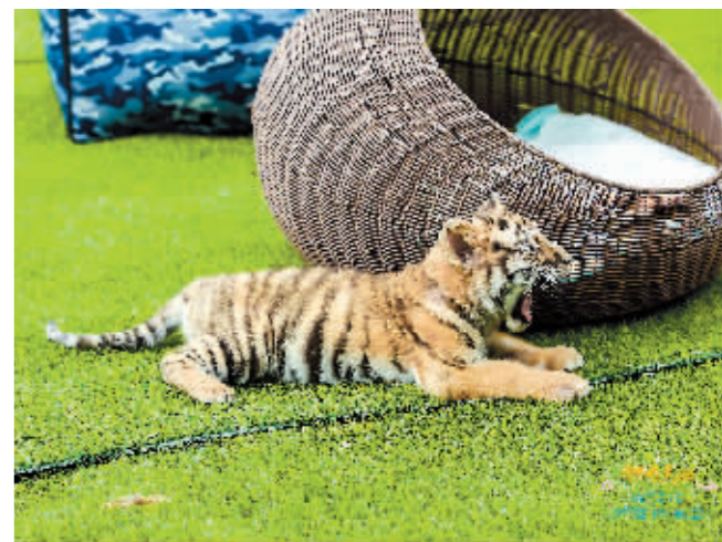
虎宝与游客打招呼“虎”。

本报讯(记者 彭庆凯)4月24日,甲辰春虎日·虎文化非遗传承荟在东北虎林园启幕。活动现场,“甲辰虎宝命名征集活动”启动,两只小老虎在萌虎乐园卖萌“走秀”。