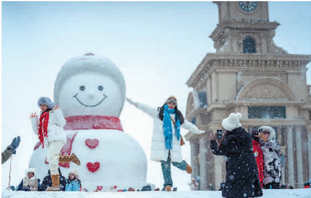
在哈尔滨音乐公园,游客与大雪人雪中“共舞”。

得益于黑龙江对于冰雪旅游的长期耕耘,2023—2024年冰雪季,黑龙江在冰雪主题线路、冰雪主题景区、冰雪相关热搜词等多个方面都成为全国第一,人均停留时长、人均消费等也成为了冰雪旅游省份的第一。