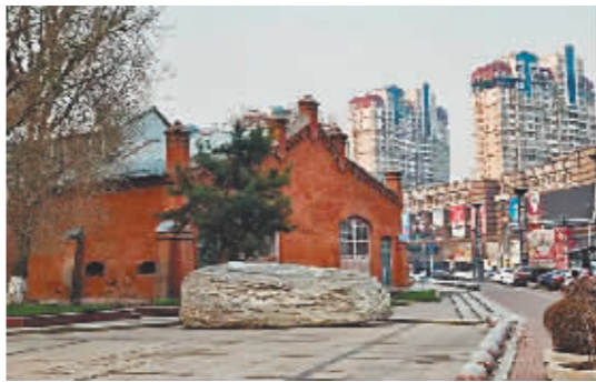
位于哈尔滨市道里区爱建路上的东省铁路哈尔滨总工厂旧址。