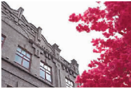
位于哈尔滨市道外区中华巴洛克历史文化街区的建筑。