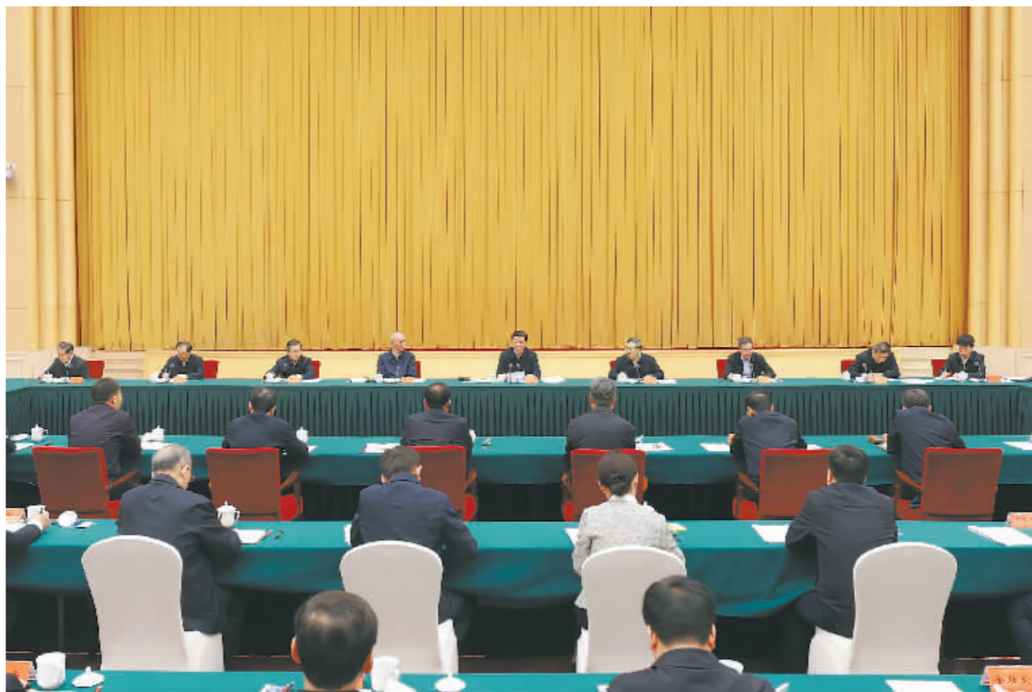
4月23日下午,中共中央总书记、国家主席、中央军委主席习近平在重庆主持召开新时代推动西部大开发座谈会并发表重要讲话。

习近平强调,要坚持把发展特色优势产业作为主攻方向,因地制宜发展新兴产业,加快西部地区产业转型升级。强化科技创新和产业创新深度融合,积极培养引进用好高层次人才,努力攻克一批关键核心技术。深化东中西部科技创新合作,建好国家自