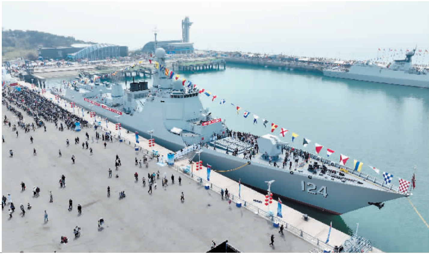
4月22日,青岛奥帆中心码头,观众在参加舰艇开放活动。

新时代以来,在习近平强军思想引领下,人民海军听党指挥,在中国特色强军之路上迈出了坚实步伐,正以崭新姿态加速向全面建成世界一流海军迈进。