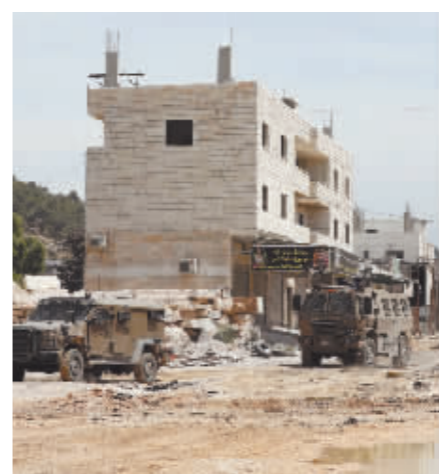
4月20日在约旦河西岸城市图勒凯尔姆拍摄的以色列军车。

据巴勒斯坦加沙地带卫生部门20日发布的消息,以军过去24小时对加沙地带的袭击共造成37人死亡、68人受伤。去年10月新一轮巴以冲突爆发以来,以色列在加沙地带的军事行动已造成超过3.4万人死亡、约7.7万人受伤。