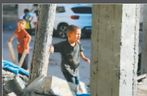
在加沙地带南部城市拉法,一名男孩在以军空袭后的废墟旁哭泣。