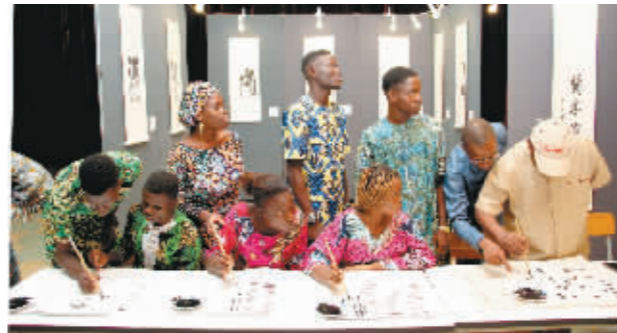
在贝宁科托努的贝宁中国文化中心,观众在“画意的书法”作品展上学习书法。