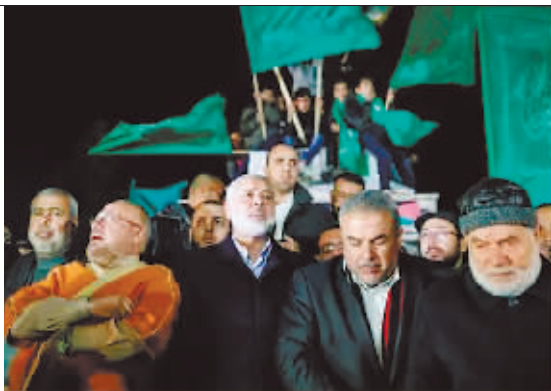
2017年12月6日,哈马斯领导人哈尼亚(前右三)出席在加沙城举行的集会,抗议时任美国总统特朗普宣布承认耶路撒冷为以色列首都。

土耳其总统雷杰普·塔伊普·埃尔多安17日在议会宣布,他将与哈尼亚举行会谈,“讨论一系列事务”。