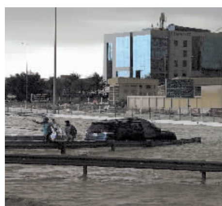
4月16日,在阿联酋迪拜,人们试图将车辆拖出积水区域。