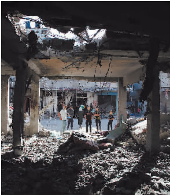
4月17日,在加沙南部城市拉法,人们查看遭以军空袭的住宅废墟。

联合国近东巴勒斯坦难民救济和工程处主任专员菲利普·拉扎里尼17日告诉联合国安理会,一场“人为的饥荒”正在整个加沙地带“加剧”,加沙北部的“婴幼儿已经开始死于营养不良和脱水”。