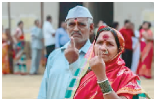
2019年4月29日,在印度孟买,选民伸出做过标记的手指。

印度是联邦制国家,议会实行两院制,分为联邦院和人民院。印度大选指的是人民院、即议会下院选举。