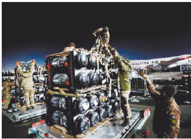
▲美国援乌的武器装备。