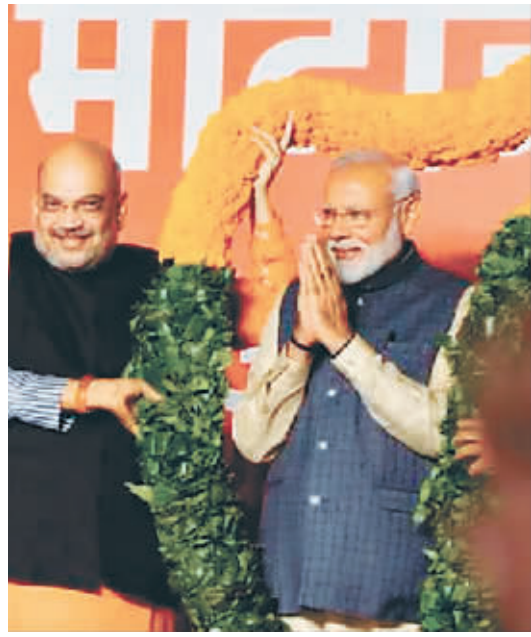
2019年5月23日,在印度新德里的人民党总部,印度总理莫迪庆祝在大选中获胜。

莫迪治下的印度经济发展迅速,他本人的超人形象在国内深入人心,而其对手、曾经长期执政的老牌大党国民大会党,也在两度失利的情况下摩拳擦掌。冲击第三个任期,莫迪能否赢得选民?