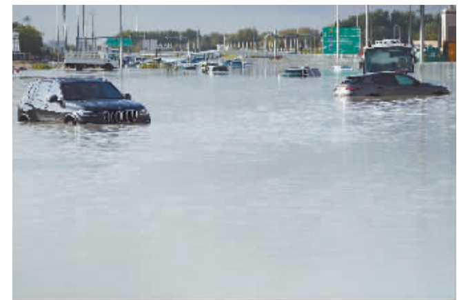
4月17日,在阿联酋迪拜,车辆被积水浸泡。

据新华社电 阿联酋国家气象中心17日确认,该国过去24小时内遭遇1949年有记录以来最强降雨。