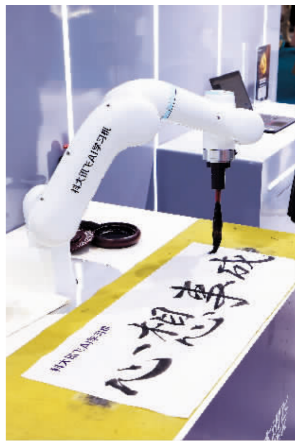
在科大讯飞展台,AI书法机器人在现场“挥毫泼墨”。