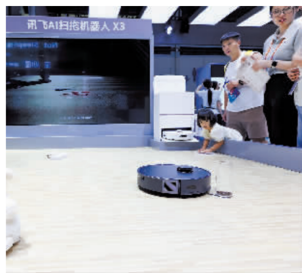
AI扫地机器人进行扫地演示。