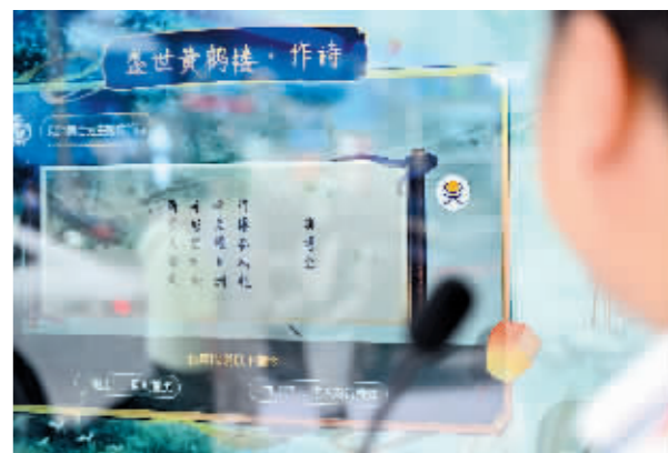
观众在消博会上观看AI作诗。