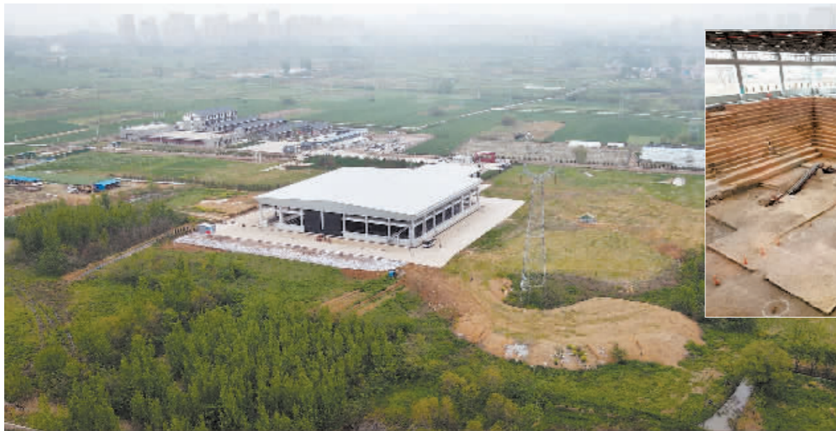
▲考古工作者重点对主墓(一号墓)进行了发掘。

“这是经科学发掘的迄今规模最大、等级最高、结构最复杂的大型楚国高等级墓葬。”国家文物局副局长关强评价道。武王墩墓的重要性可见一斑。