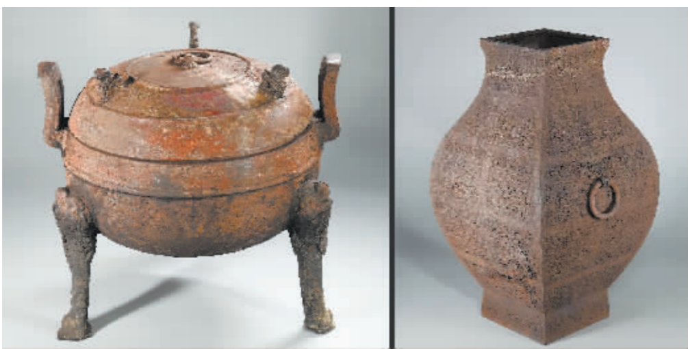
安徽淮南武王墩主墓内出土的部分青铜器。