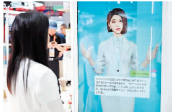
消博会上的一款“AI数字人”在回答观众提问。

正在海南举行的第四届消博会上,众多人工智能技术产品引人关注。珠宝设计、智能机器人等与AI相结合的消费品,展示出人工智能技术已被应用到越来越多的生活消费场景,正走入千家万户。