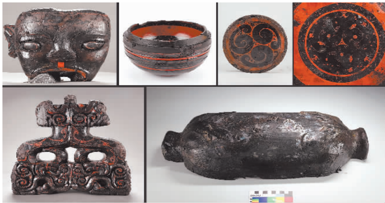
安徽淮南武王墩主墓室出土的部分漆器。