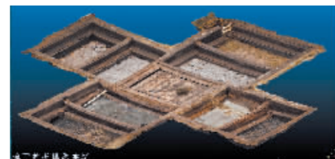
安徽淮南武王墩主墓椁室盖板揭露完后的情况。