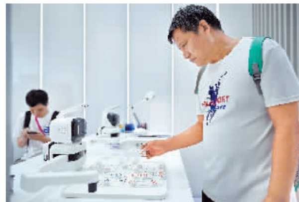
观众在消博会上与AI下棋机器人对弈。