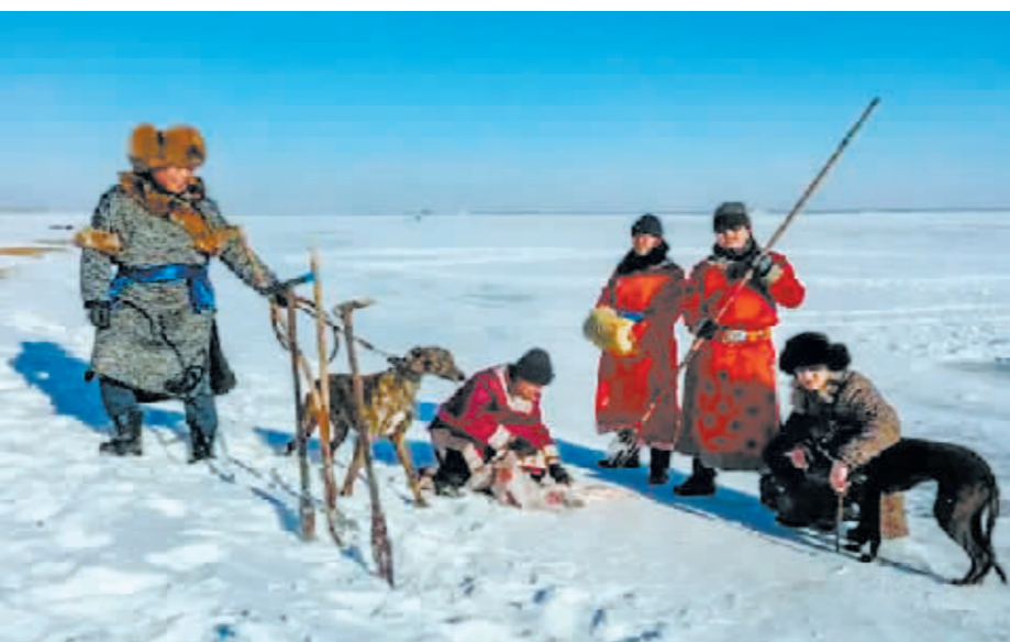
达斡尔族的渔猎生活。