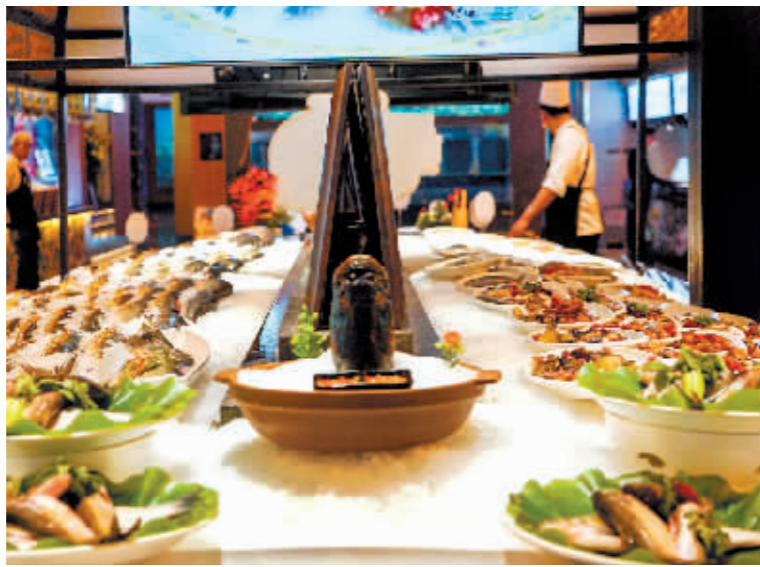
开江鱼端上百姓餐桌。