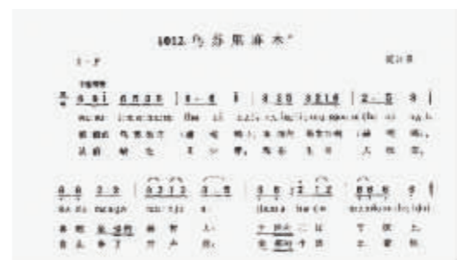
赫哲族民歌《乌苏里麻木》曲谱。

“啊朗赫赫呢哪 啊朗赫赫呢哪,啊朗赫赫呢哪赫赫雷,给根……”脍炙人口的《乌苏里船歌》根据赫哲族的“嫁令阔”(即小调、小曲的意思)改编。虽然《乌苏里船歌》曲调来源与这首“船歌”无关,但在歌曲开头与结尾出现的吆喝式的唱腔“啊朗赫赫呢哪”却是对应上了《乌苏里麻木》中的衬词“赫呢哪”。