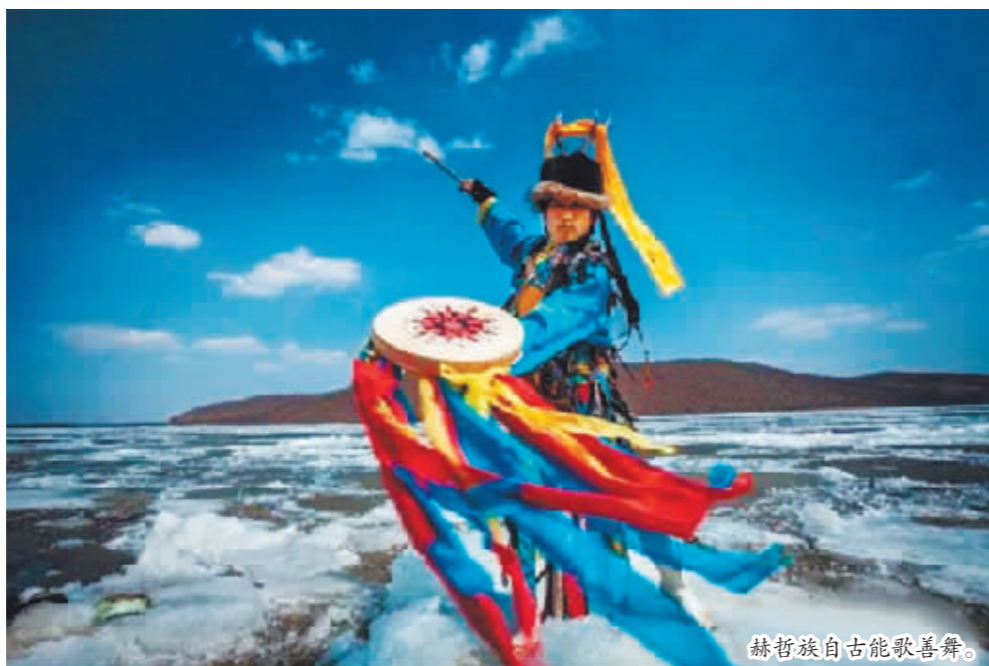
赫哲族自古能歌善舞。

奔流不息的松花江是哈尔滨的母亲河,冰封半年的松花江开江,就意味着哈尔滨的春天真的来了。在一年一度开江节即将到来之际,除了美味的开江鱼,开江节的民俗、民歌、民曲也值得大家关注。哈尔滨日报今天起,推出“渔歌唱春”系列报道,让来到哈尔滨的中外宾朋“踏歌而来”感受开江节的民俗文化。