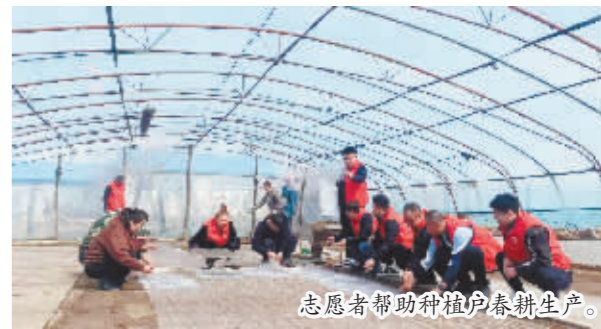
志愿者帮助种植户春耕生产。

本报讯(曹群 记者 张大星)眼下正值春耕备耕的关键时机,延寿县组织农业技术人员、青年志愿者深入田间地头助力春耕生产,引导种植户抢抓农时,提早开展春耕备耕,全力以赴保障春季农业生产,牢牢保障粮食安全。