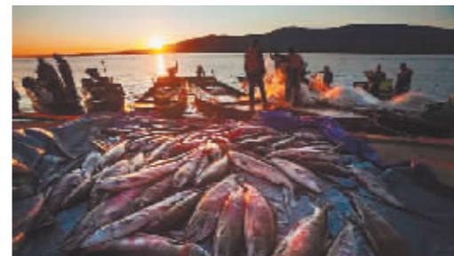
赫哲族的渔猎生产场景。

在2017年中央电视台春节联欢晚会哈尔滨分会场上,表达黑龙江流域赫哲族群众幸福生活的传统民歌《赫哲渔歌》再次惊艳世界。该作品是由哈尔滨音乐学院的师生们依据赫哲族原生文化而创作的一首跨界声乐作品。空灵悠扬的女声独唱把古老的曲调与现代音乐完美融合在一起,少数民族服饰、非遗传承项目的展示随着音乐共同演进,将观众带到乌苏里江上,带进赫哲人的船舱,把观众的遐想织进一张张渔网,真正体会赫哲人的渔猎生活场景和丰收的喜悦心情。