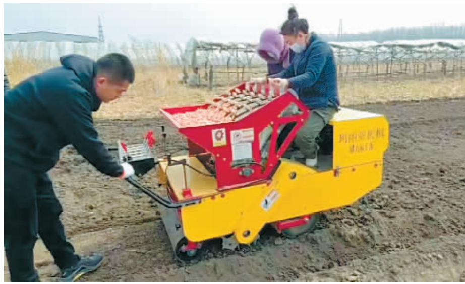
农户尝试机械播种大蒜。

“打造农产品区域品牌已成为地方政府进行农业品牌建设的关键抓手,在很多地方的实践中,出现了‘单品类’农产品区域品牌发展模式。‘单品类’是指仅包括某单一农产品品类并以‘产地名+产品名’命名的农产品区域公用品牌。‘阿城蒜’就是标准的‘单品类’农产品区域品牌,文化赋能更容易。”陈海龙说,“阿城蒜”早在金代就开始种植了,为了讲好“阿城蒜”的故事,阿什河街道党工委还专门请教了金史专家来支招,希望通过挖掘、传承优秀传统文化遗产的方式来为“阿城蒜”的品牌建设注入新动能。