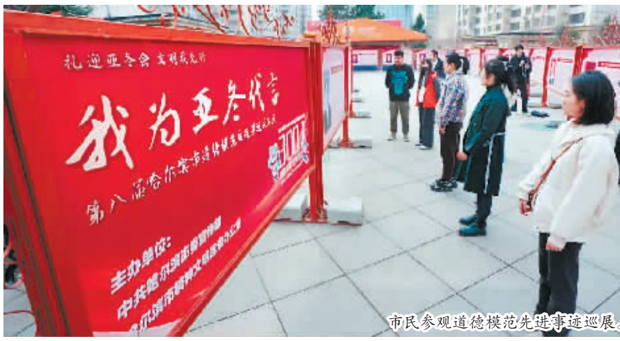
市民参观道德模范先进事迹巡展。

本报讯(记者 刘姝媛)为提升市民素质,营造浓厚的迎接亚冬会氛围,引领社会风尚,共铸冰城文明,发挥先进典型在精神文明建设中的示范引领作用,近日,由市委宣传部、市文明办主办的“我为亚冬代言”