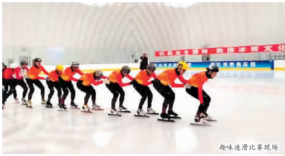
趣味速滑比赛现场。

本报讯(记者 刘姝媛)日前,道里区举行“相约亚冬 共享精彩”大众速滑趣味比赛及老年冰球比赛,共有5支队伍70余名选手参加本次赛事。本次赛事的成功举办,充分营造了冰