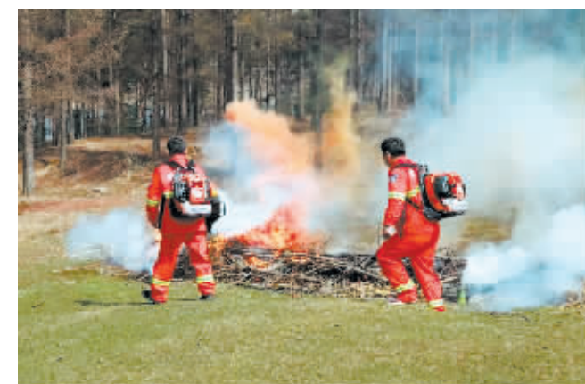
消防员在“火灾”现场展开扑救。

本报讯(记者 康福柱)4月13日,阿城区在亚沟林场砬子沟施业区举行春季森林草原防灭火演练,进一步提升应急处置能力。