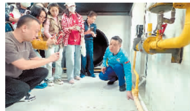
燃气专家讲解燃气安全隐患。

本报讯(记者 王丹文/摄)4月14日,哈尔滨中庆燃气有限责任公司与市教育局联合开展面向全市中小学、幼儿园安全管理人员、后勤管理人员、食堂具体操作人员的燃气安全培训。