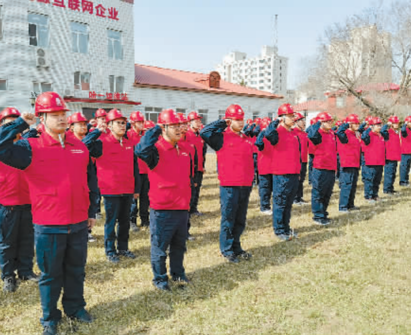
全体服务队队员面向队旗宣誓。