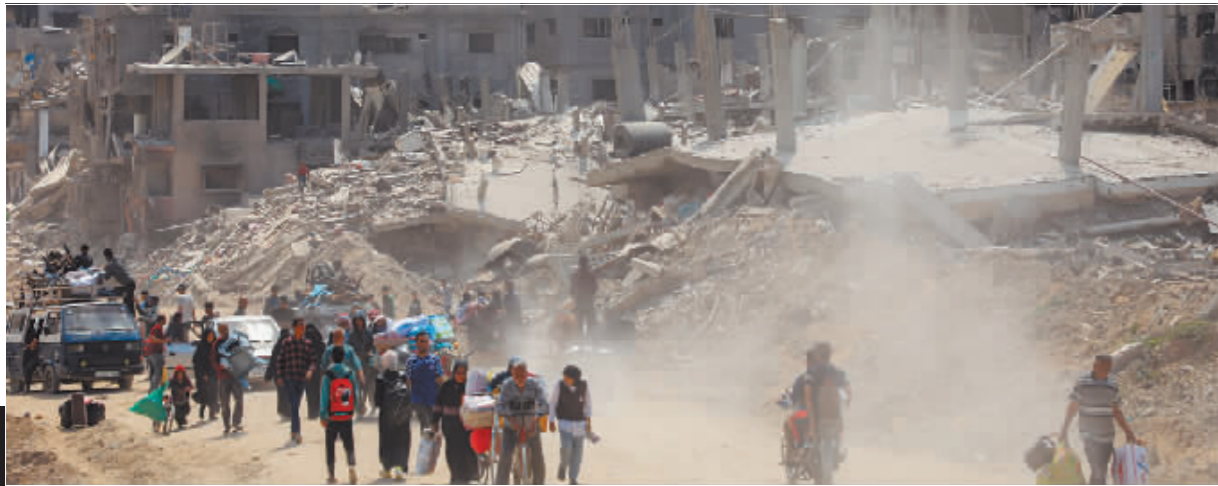
4月8日,在加沙地带南部城市汗尤尼斯,人们在以军撤离后返回家园。

多方代表8日说,巴勒斯坦加沙地带停火及释放被扣押人员新一轮谈判取得“显著进展”,是“最接近达成协议的一次”。然而,以色列总理本雅明·内塔尼亚胡当天晚些时候强调,以军“有一天”会进攻加沙地带南部城市拉法。巴勒斯坦伊斯兰抵抗运动(哈马斯)方面则表示,以方提出的停火协议方案没有满足巴方要求。