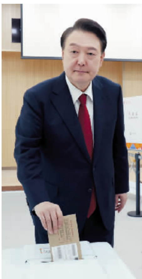
4月5日,韩国总统尹锡悦在釜山的一处投票站参加投票。

韩国国会议员选举将于10日拉开帷幕,争夺共计300个国会席位。韩国媒体认为,本次选举是对面临“朝小野大”局面的总统尹锡悦执政近两年来的“中期考核”,直接决定未来四年国会主导权和朝野政党的地位、影响力,也会对下届总统大选潜在候选人产生影响。对这场选举,各政党及候选人的相互攻讦已经进入“白热化”阶段。在医疗界与政府对峙僵持状况下,朝野双方相互攻击,争议不断。