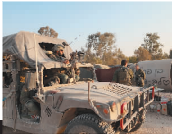
这是4月7日拍摄的加沙地带和以色列边境以色列一侧的以军部队。