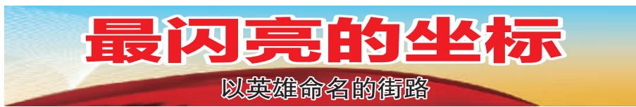
最闪亮的坐标 以英雄命名的街路

上世纪90年代,哈尔滨市人民政府在一曼街东北烈士纪念馆对面三角地修建了一曼广场,竖立赵一曼烈士塑像,供人瞻仰。如今,洒满烈士鲜血的这方热土一片祥和、温馨。“四海今歌赵一曼,万民永忆女先锋”,郭沫若的诗句表达了我国亿万人民对赵一曼烈士的怀念之情。