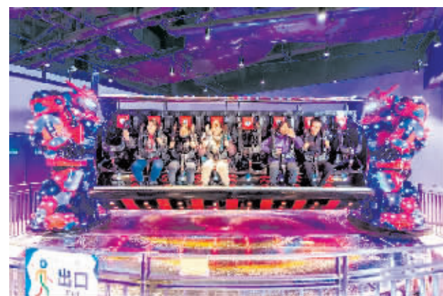
游客体验紧张刺激的游乐项目。

本报讯(记者 张鸣霄)哈尔滨冰雪大世界四季游乐馆是省内最大的室内亲子互动主题乐园,占地面积约13000平方米,包括淘气堡、冰道、摩天轮等项目,可满足