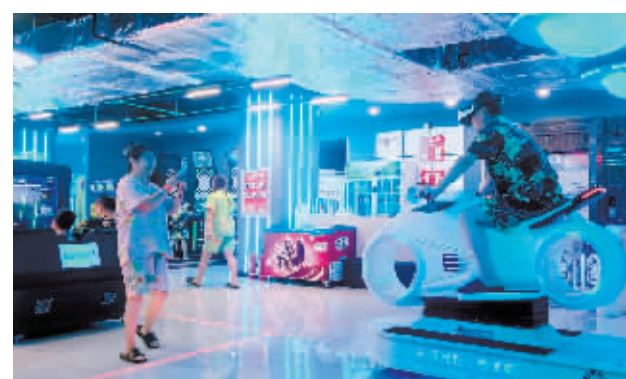
市民、游客享受惬意假期。

本报讯(记者 李佳琪文/摄)清明假期去哪儿了?不少市民、游客选择冰城的洗浴中心。4月6日,记者在道里区一家洗浴中心内看到,不少家长带着孩子来到洗浴中心“度假”。该洗