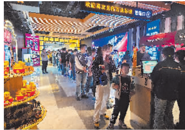
排队等待入场的观众。

本报讯清明假期首日,万达影城哈尔滨西店迎来5000多人次观众,影城大厅人头攒动。据灯塔专业版显示,截至4月6日15时,哈尔滨清明档票房达520万元。