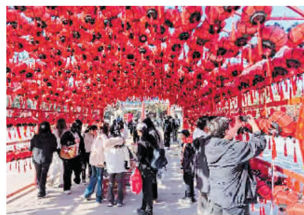
省民族博物馆游人如织。

本报讯(记者 于博洋)清明假期,省博迎来参观热潮。3天假期,黑龙江省博物馆参观人数近2万人次(含