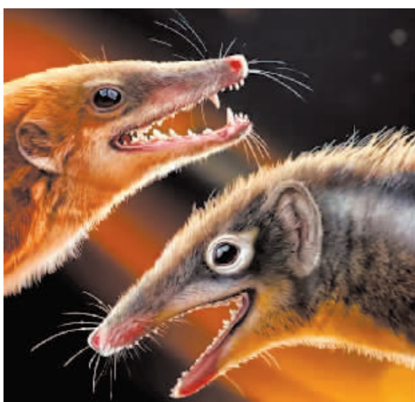
“周氏近柱齿兽”和“杨氏滇尖齿兽”生态重建图。

新华社北京4月4日电 从爬行动物到哺乳动物的演化过程中,有两个最重要的形态和功能变化:牙齿从简单到复杂以提高摄食能力,下颌头骨关节变为中耳听骨组合以提高听觉效力。中外科学家近期对我国两种侏罗纪哺乳动物新化石的研究,揭示了哺乳动物最早的牙齿分化、中耳和颌关节转化,重塑和完善了早期哺乳动物的系统发育框架。