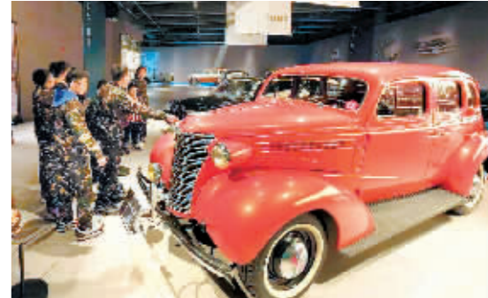
古董车吸引游客驻足。

本报讯(记者那跃娜文/摄)清明小长假第一天,作为国家级国防教育基地的哈尔滨世纪汽车历史博物馆人气爆棚,首日游客数量达到1万人次,比春节假期高峰日游客量增加30%。