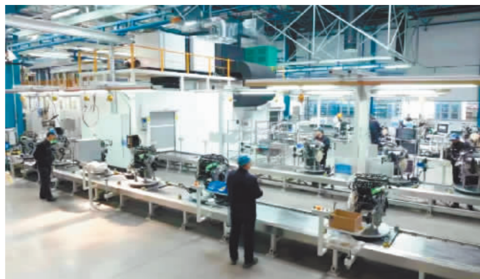
东安动力车间内一片繁忙景象。

第三次创业以兵器装备集团“133”战略和中国长安“1347+”战略目标为牵引,坚持公司“1235”战略,坚持特色的系统集成能力,坚持传统动力升级与新能源动力发展两端发力,聚焦“成本突破、创新突破、改革突破”三大关键点,围绕22项重点任务,兼顾一定的系统性、逻辑性和延续性,以更具改革发展针对性和穿透力的措施为支撑,持续增强成本优