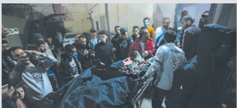
民众将空袭事件遇难者的遗体转移至加沙地带中部阿克萨医院。

巴勒斯坦红新月会2日发表声明说,以色列军队1日晚空袭加沙地带中部城市代尔拜拉赫,造成慈善组织“世界中央厨房”7名工作人员死亡。“世界中央厨房”同日发表声明,确认7名工作人员在以军空袭中丧生,遇难者国籍包括英国、波兰和澳大利亚,另外还有一人拥有美国和加拿大双重国籍以及一名巴勒斯坦人。声明同时表示,该组织将暂停其在加沙地带的援助行动。世界中央厨房近期配合美国和以色列,经海路向加沙地带北部运送援助物资。白宫对这次空袭“深感困惑”。