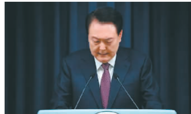
韩国总统尹锡悦发表讲话。

据新华社电 韩国总统尹锡悦4月1日就医学院扩招及医疗改革发表讲话,对未能及时化解医疗界“罢工潮”给国民带来不便深表歉意。自韩国政府今年2月公布医科大学扩招方案后,大批医院医生罢工、医学院学生罢课,医学院教授也提出集体辞职,造成诊疗混乱。政府和医疗界的对峙已经持续两个月,双方一直态度强硬、互不相让。韩国媒体和分析人士认为,尹锡悦在这一时间点道歉与即将到来的选举不无关系。尹锡悦支持率2月上升的助推因素之一是推进医科大学扩招,但如今实习和住院医生罢工,在医疗空白长期化影响下,韩国民众对于医疗改革的态度也逐渐从支持变成有所动摇。然而总统道歉看似诚恳,实则并没有道进医疗界的“心坎儿”里。大韩医师协会1日就尹锡悦涉医疗改革谈话表示,此次谈话的内容与政府此前所发表的观点毫无区别,令人失望。尹锡悦在道歉时再次强调了政府实施医改的决心和扩招必要性。他表示,扩招2000人是政府经严密计算并与医疗界充分讨论后得出的结论。如果医疗界希望缩小扩招规模,并能给出更妥当、更合理的方案,政府完全持开放态度进行讨论。分析认为,尹锡悦的讲话并未达到“消除矛盾”的目的,没有积极提出对策,而是将“皮球”踢给医疗界,尚不足以帮助执政党在国会会议上选举中挽回劣势。受“罢工潮”影响,韩国国内近期出现救护车载着病人辗转十多家家医院无人接收、病人因未得到及时医治而死亡、首都圈几家大医院的手术和诊疗量减半等情况。如果医疗界和政府间的分歧无法尽快弥合,未来韩国医疗体系恐将面临更多混乱。