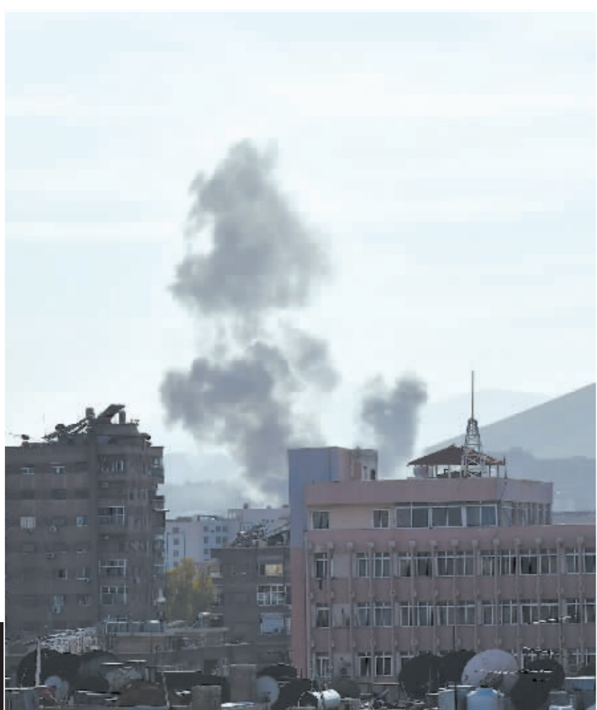
4月1日在叙利亚首都大马士革拍摄的爆炸后升起的浓烟。

伊朗方面1日说,伊朗驻叙利亚大使馆领事部门建筑当天遭以色列导弹袭击,造成至少7人身亡。叙伊两国强烈谴责以方的“野蛮”空袭,伊朗表示保留采取反制措施的权利。近年来,以色列军队以打击伊朗军事设施为由频繁空袭叙境内目标,这是伊朗驻叙大使馆首次遭到空袭。分析人士认为,在新一轮巴以冲突影响不断外溢、地区多个方向局势紧张的背景下,此次袭击意味着以对抗的进一步升级,地区局势将被推向更危险的境地。