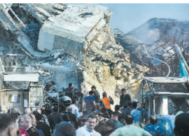
在叙利亚首都大马士革,人们聚集在袭击现场。