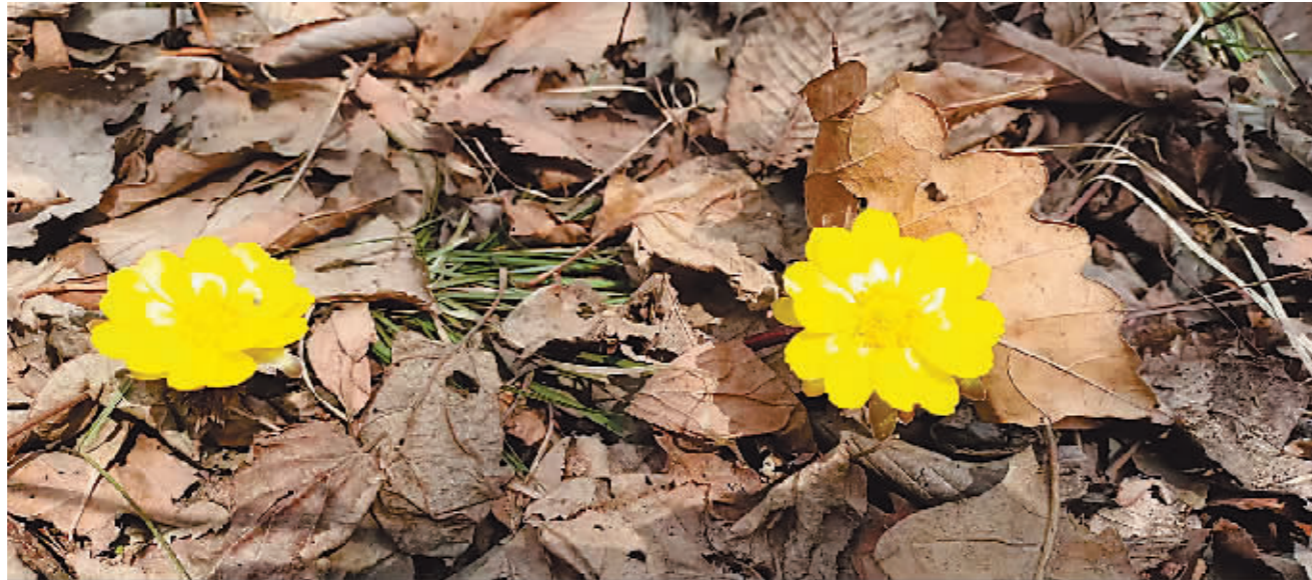
壹台山上绽放的冰凌花。

清明节前后。景区工作人员介绍,冰凌花具有朝开夕合的特点,通常情况下在零上六七摄氏度以上的天气,冰凌花接近中午时处于开放阶段。景区冰凌花分布范围非常大,工作人员已经在山路中清出了一条小路,方便花友们寻花赏花。