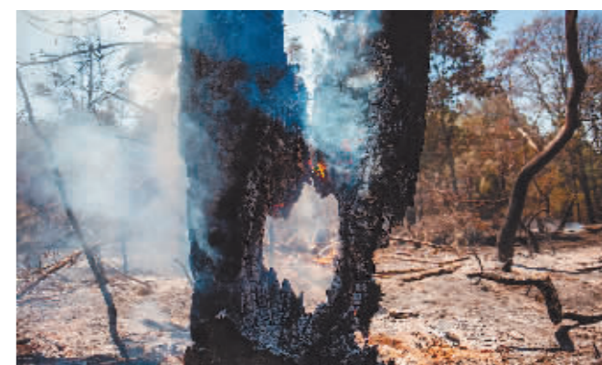
这是3月26日在墨西哥拍摄的林火现场。

新华社北京3月28日电 墨西哥总统洛佩斯27日说,该国新一轮林火已造成至少4人死亡。