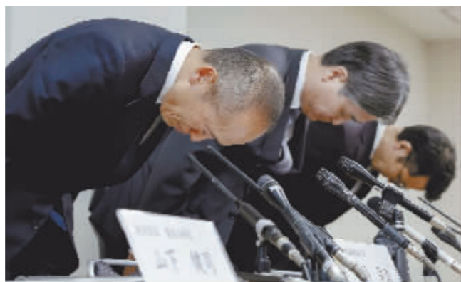
3月22日,小林制药公司社长小林章浩(左一)在记者见面会上鞠躬致歉。