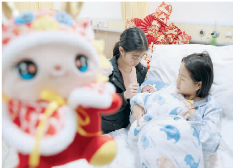
2月10日,在江苏无锡怡和妇产医院产科病区,一名刚出生的“龙宝宝”和妈妈、姐姐在一起。

生育是家之大事,也是国之大事。病有所医,老有所养,莫不如此。让14亿多人获得更加公平可及的医疗服务,不仅需要扩