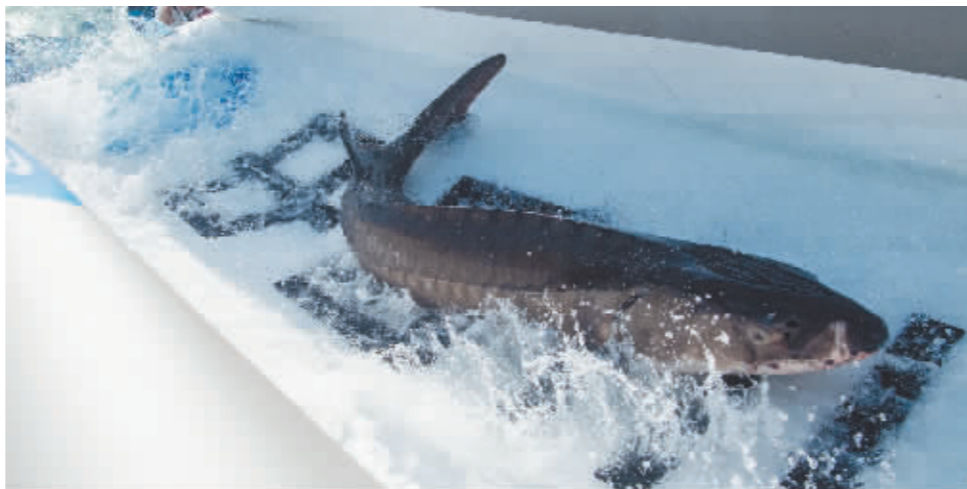
3月28日,一条中华鲟从放流通道放归长江。

农业农村部长江流域渔政监督管理办公室主任江开勇说,今年起,农业农村部将进一步增加中华鲟保护经费投入,加大人工保种力度,扩大人工繁育和增殖放流规模,加强科研和监测,实施栖息地修复,计划通过3至5年达到年增殖放流500万尾的规模。