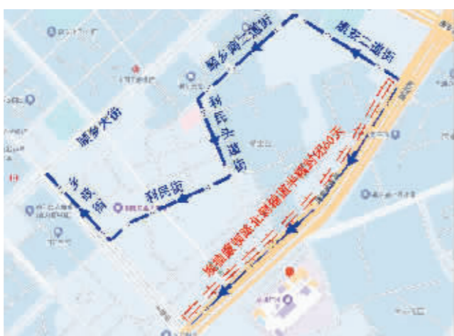
途经埃德蒙顿路的车辆,可通过康安二道街、颐乡南二道街、利民头道街、利民街绕行。