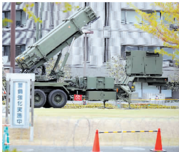
2013年4月9日,在日本东京的防卫省总部,“爱国者3型”导弹发射装置停放在院内。

防卫”承诺;其次,大幅增加防卫预算,为大力发展防卫产业做准备;再次,即从2023年底开始,短短3个月内两次大幅修改《防卫装备转移三原则》及其实施方针,使日本生产的杀伤性成品武器不仅可以直接出口至给予日本“生产许可”的授权国,还可以附带条件地出口至世界15个国家。自此日本向全球大幅出口杀伤性武器的大门已被彻底推开。