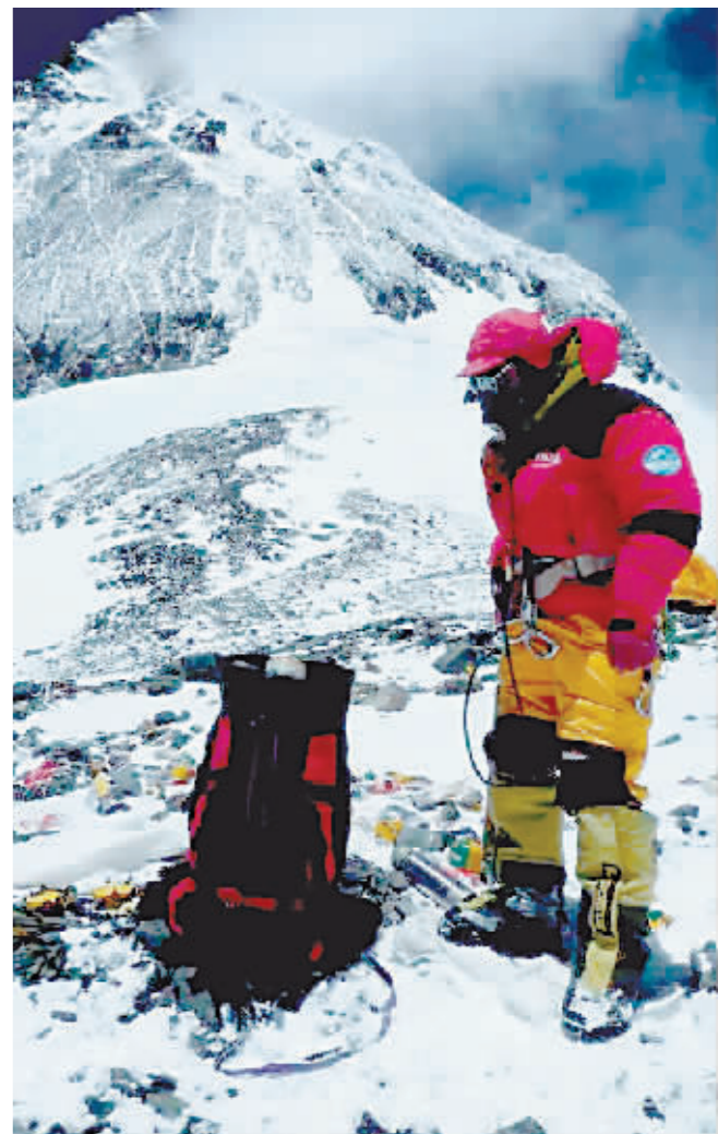
这是2010年5月22日,人们将萨迦玛塔国家公园普莫里峰峰地的垃圾打包,准备带回纳姆切巴扎基地进行处理。萨迦玛塔(尼泊尔语中“珠穆朗玛峰”)国家公园位于尼泊尔昆布地区,坐落于珠穆朗玛峰南坡。

氧气、冰爪、登山杖……登山者开始攀登珠穆朗玛峰之前,行李单上恐怕还得添上拾便袋。根据尼泊尔地方政府的最新要求,从今年开始,从尼泊尔一侧攀登珠穆朗玛峰的登山者,必须携带自己登山期间排泄的粪便返回。