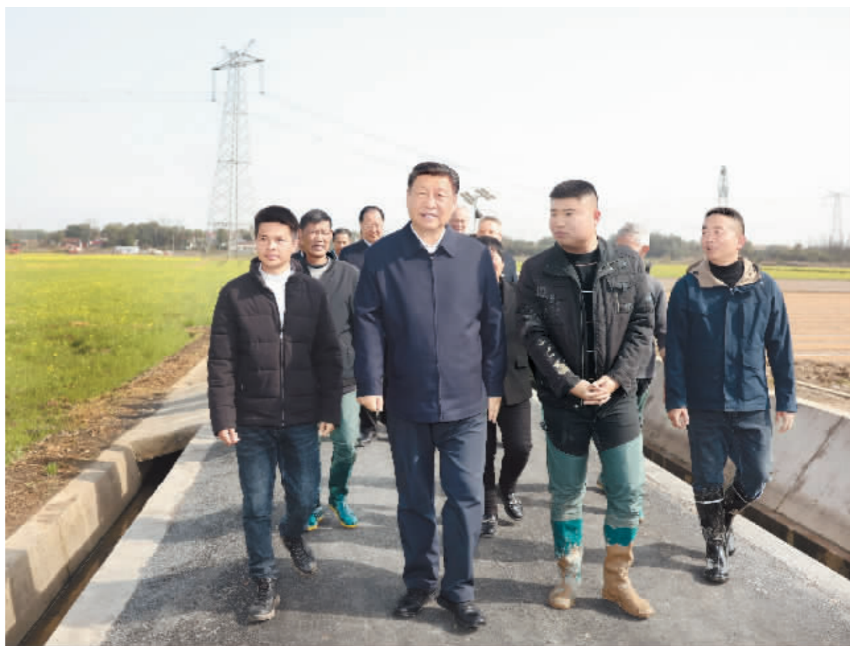
3月18日至21日,中共中央总书记、国家主席、中央军委主席习近平在湖南考察。这是19日下午,习近平在常德市鼎城区谢家铺镇港中坪村,同种粮大户、农技人员、基层干部亲切交流。

新华社长沙3月21日电 中共中央总书记、国家主席、中央军委主席习近平近日在湖南考察时强调,湖南要牢牢把握自身在构建新发展格局中的战略定位,坚持稳中求进工作总基调,坚持高质量发展不动摇,坚持改革创新、求真务实,在打造国家重要先进制造业高地、具有核心竞争力的科技创新高地、内陆地区改革开放高地上持续用力,在推动中部地区崛起和长江经济带发展中奋勇争先,奋力谱写中国式现代化湖南篇章。