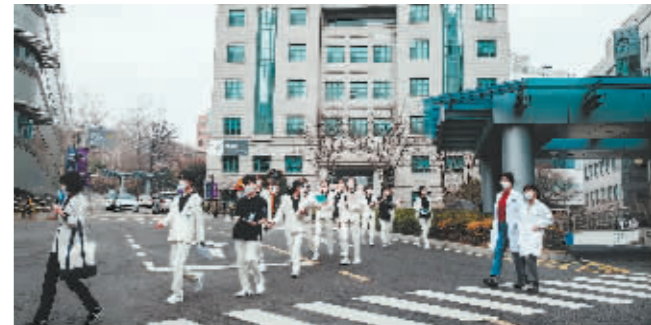
3月19日，医疗工作者从韩国首尔一家医院外走过。

据新华社电 韩国媒体18日报道，韩国保健福祉部已向大韩医师协会两名官员发出吊销其行医执照的最终通知，这是此次医生“辞职潮”开始以来，韩国政府首次正式吊销离岗医生行医执照。