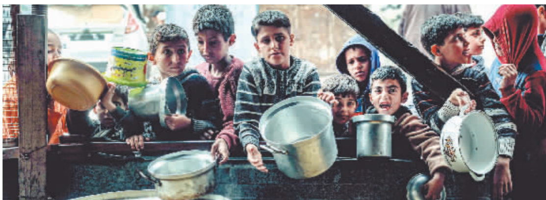
在加沙地带南部拉法，几名巴勒斯坦儿童等待领取食物。

美国总统国家安全事务助理杰克·沙利文说，内塔尼亚胡同意派代表赴美，就以军预期在巴勒斯坦加沙地带南部城市拉法发起的行动与美方沟通，美方届时将提出“替代方案”，即仅打击巴勒斯坦伊斯兰抵抗运动(哈马斯)在拉法的关键目标、避免在这一毗邻埃及的边境地区出现大规模地面行动。