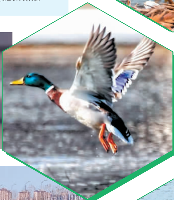
本报记者 王铁军 / 文