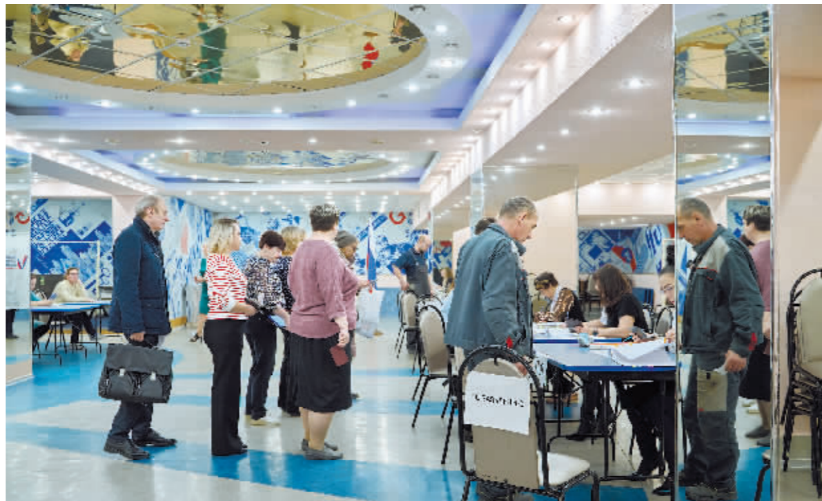
3月15日,当地居民在俄罗斯符拉迪沃斯托克排队登记参加总统选举投票。

去年12月,俄新人党推举达万科夫为总统竞选人。这位出生于1984年的政治家提出的竞选口号是“新人的时代”。