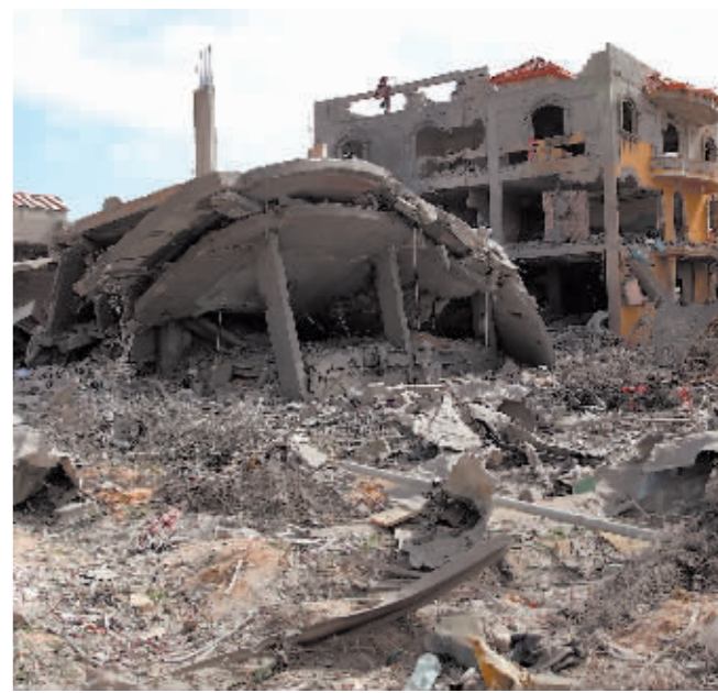
3月14日,加沙地带一难民营遭轰炸后的场景。

新华社北京3月15日电 综合新华社驻耶路撒冷、开罗记者报道:以色列总理办公室14日说,巴勒斯坦伊斯兰抵抗运动(哈马斯)关于停火的要求“不切实际”,以方将讨论是否继续谈判。同日,埃及总统塞西和西班牙外交大臣阿尔瓦雷斯在会谈时强调,反对以色列军事行动升级,有必要立即在加沙实现停火。