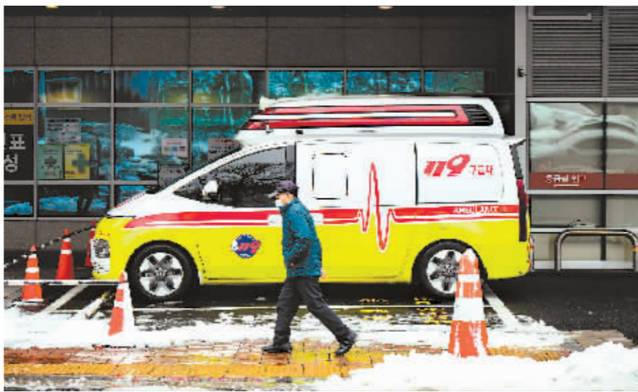
2月22日,一名男子走过韩国首尔一家医院外的急救车。

韩国媒体指出,因医科大学扩招而罢工医生在全球少见,凸显韩国医生群体作为既得利益者不愿“分蛋糕”的心态。这一群体在韩国属高收入人群,他们反对扩招缘于自己是受政策影响最大的利害当事人,医生增加,收益就会相对减少。