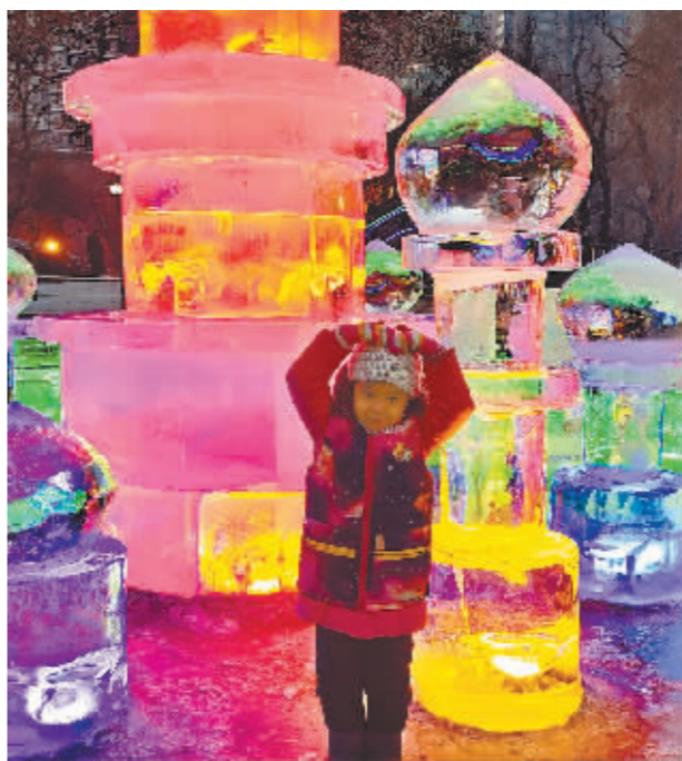
小朋友快乐“打卡”冰灯艺术游园会。

给上百万游客留下难忘冰雪记忆的第50届哈尔滨冰灯艺术游园会,在和游客依依惜别的同时,也点燃了众人对第51届哈尔滨冰灯艺术游园会的期待,期待下一个冰雪季再相逢,共赴冰雪之约!