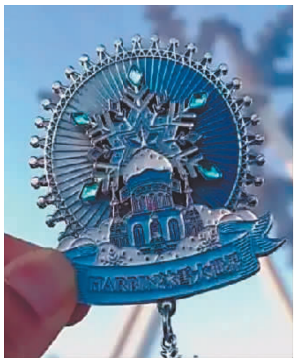
冰雪大世界AR冰霜贴。

新华社哈尔滨3月12日电 随着气温升高,火爆了一个冬天的冰雪季落幕,但冰雪经济与创意设计产业的碰撞持续在哈尔滨上演。