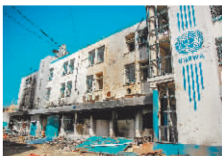
在加沙地带加沙城拍摄的近东救济工程处办公楼。

就以方1月份的指认,联合国正开展一项独立调查和一项内部调查,那12名雇员已被解雇。以方近来还指控近东救济工程处400多名雇员是“加沙地带恐怖组织武装人员”,但未提供证据。近东救济工程处4日指责以色列对其雇员“刑讯逼供”,散布关于该机构不实信息,企图令这一机构解散。