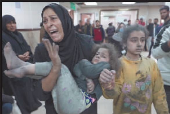
▲受伤的巴勒斯坦人来到医院寻求治疗。