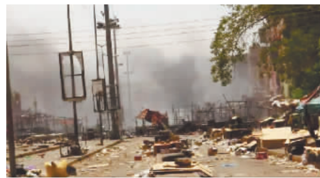
2023年4月18日在苏丹喀土穆拍摄的武装冲突爆发后的街头景象。

据新华社电 苏丹快速支援部队9日对联合国安全理事会一份敦促苏丹冲突方在斋月期间停止敌对行动的决议表示欢迎。前一天,苏丹主权委员会主席兼武装部队总司令阿卜杜勒·法塔赫·布尔汉也对决议表示欢迎。