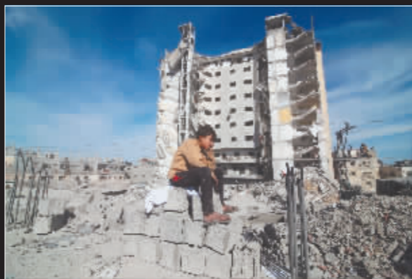
▲一名巴勒斯坦男孩坐在以军袭击后的建筑废墟上。▲加沙地带建筑遭袭后升起浓烟。