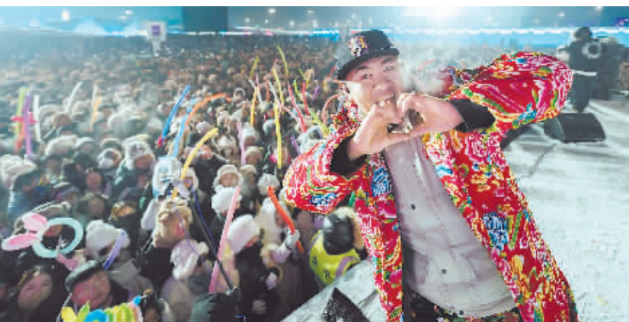
“左右哥”在冰雪大世界舞台上与游客互动。本报记者 陈南挺

就是自己责无旁贷的义务。“今天我们来到了‘东北的卢浮宫’——哈药六厂。”“今天我带你找一找哈尔滨的龙脉——黑龙广场。”……在“左右哥”最新推送的几条宣传家乡的短视频下,网友们纷纷留言“跟着‘左右哥’游哈尔滨长知识”“这推送做得到位,传说与现实结合,弘扬中华文化!”“‘左右哥’一直在宣传家乡,为你点赞!”