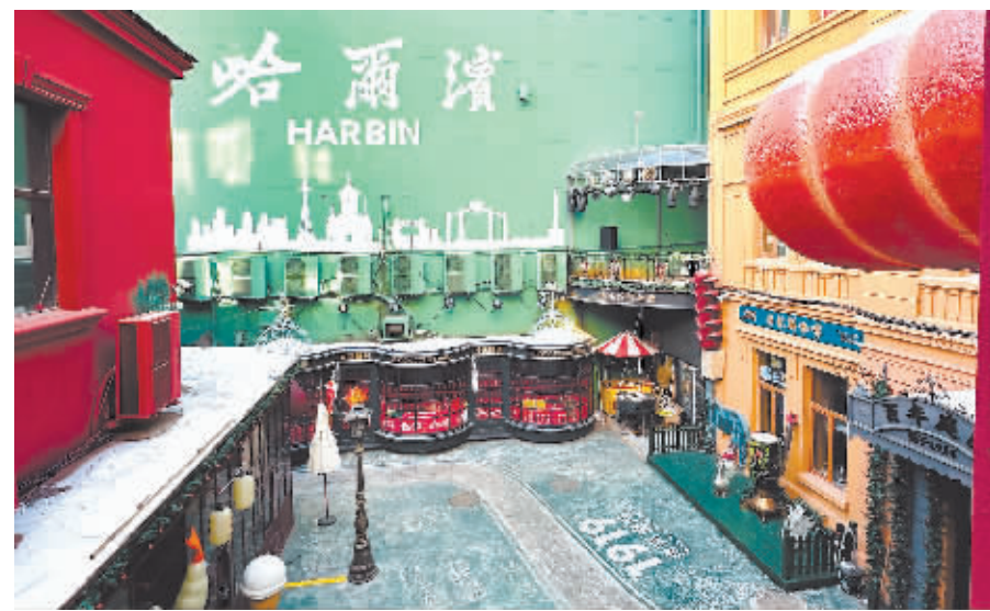
梅金·肖克百年庭院。