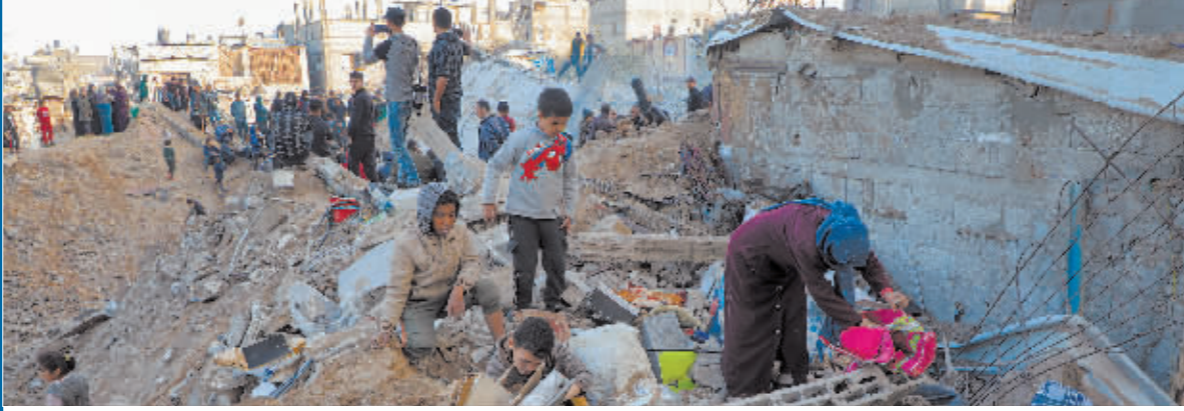
2月20日,在加沙地带中部努赛赖特难民营,巴勒斯坦人查看以军空袭后的损毁情况。

多家媒体2日援引消息人士的话报道,多方谈判代表最早可能于3日抵达开罗,开启新一轮加沙地带停火谈判。美国方面一名官员2日告诉路透社,一份有关暂时停火6周的协议框架已经基本敲定,且获得以色列方面同意。目前还需要哈马斯方面同意在停火期间释放其扣押人员。上一轮谈判2月下旬在卡塔尔首都多哈举行。会后消息显示,以色列和哈马斯在斋月前达成6周暂时停火协议的可能性增大。美国总统约瑟夫·拜登2月26日说,他希望以色列与哈马斯在3月4日这周能够实现停火。不过,多方人士同时透露,以色列与哈马斯的分歧依然存在。以方先前宣称在哈马斯遭清除前不会结束军事行动,哈马斯则说在达成永久停火协议前不会释放以方人员。埃及和哈马斯方面的消息人士2日说,哈马斯目前并没有改变立场,认为临时停火必须是永久停火的开始。不过埃及消息人士称,已向哈马斯方面保证,永久停火相关条款将包含在第二和第三阶段停火方案中。今年1月以来,以色列、美国、埃及和卡塔尔围绕以色列和哈马斯之间的停火协议举行多场谈判,讨论三阶段停火方案等事宜。哈马斯和以色列拒绝面对面谈判,由埃及和卡塔尔在二者之间“传话”。以色列“新消息”电视台2日援引一名以方高级官员的话报道,在收到目前仍活着的遭哈马斯扣押人员名单以前,以方不会派代表前往开罗参加新一轮谈判。