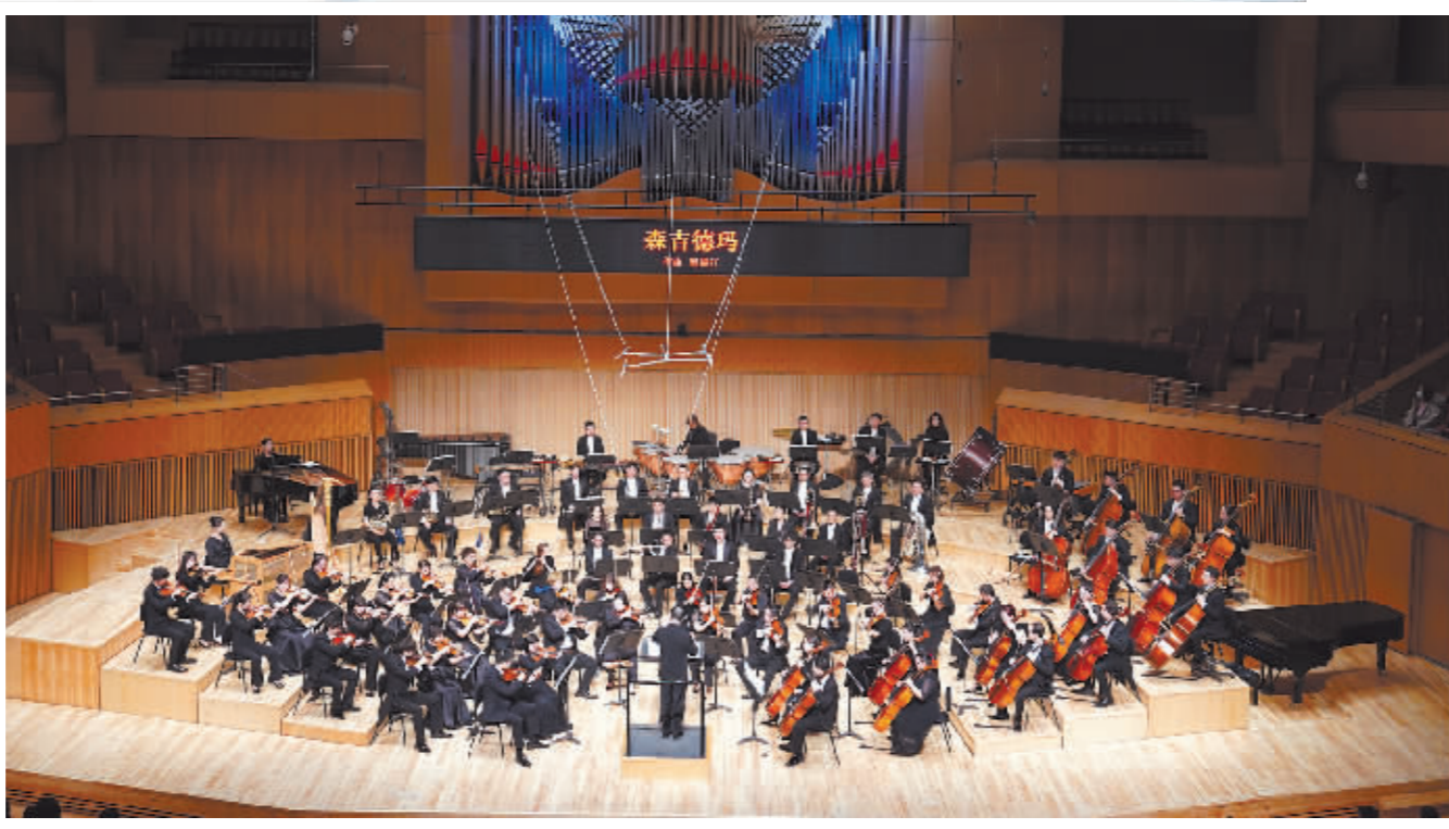
右图:交响音乐会演出现场。

音乐会下半场上演了多首脍炙人口的西方交响乐作品。格林卡的《鲁斯兰与柳德米拉》、德沃夏克的《斯拉夫舞曲》、柴可夫斯基的《天鹅湖》组曲、埃尔加的《谜语变奏曲》、比才的《法兰多拉舞曲》、哈哈图良的《圆舞曲》等,辉煌明亮的交响乐作品奏响了朝气的春日乐章,让乐迷徜徉在美妙的乐曲中。