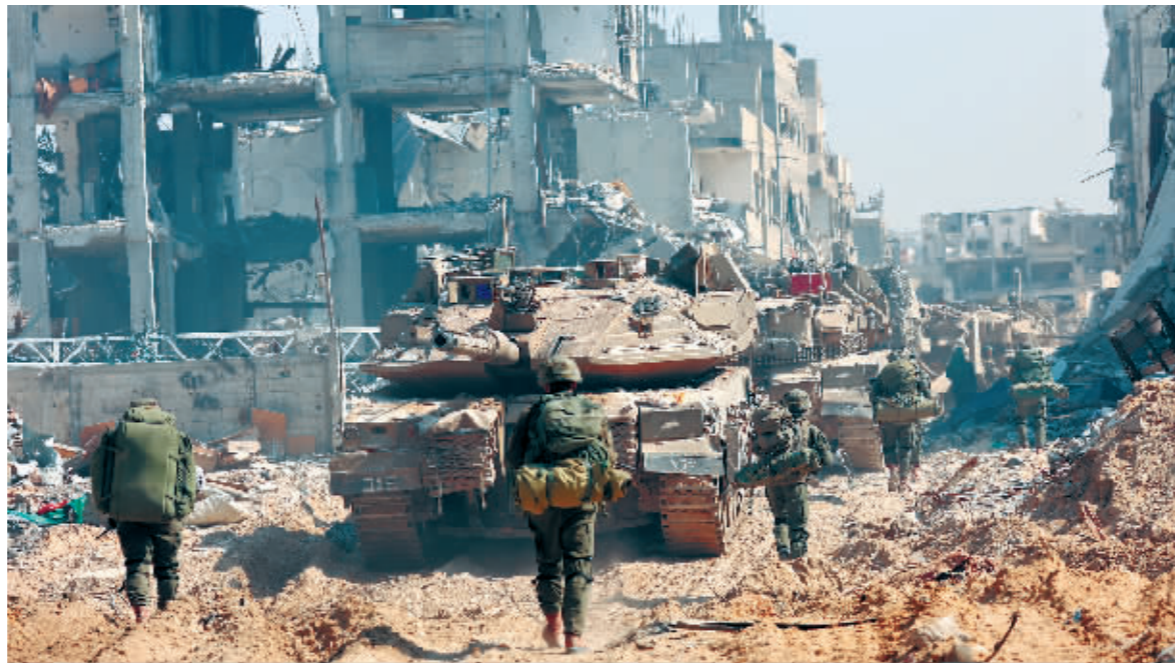
2月28日,以军部队在加沙地带南部城市汗尤尼斯展开军事行动。