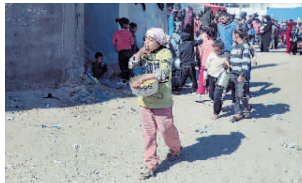
2月9日,在加沙地带南部城市拉法,巴勒斯坦儿童领取完救济食物后返回。

联合国和多个阿拉伯国家等对这起事件表示谴责。美国总统拜登说,这起事件可能使正在进行的加沙停火谈判更为复杂。