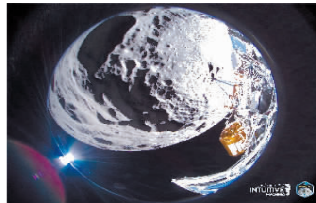
月球着陆器“奥德修斯”拍摄的月球景象。

美国私营企业“直觉机器”公司2月29日说,其研发的月球着陆器“奥德修斯”登月一周后,随着月球南极地区夜幕的降临进入休眠状态。如能熬过寒冷的月夜,它可在两三周后“苏醒”。