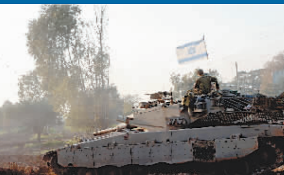
2月25日在加沙边境以色列一侧拍摄的以军部队。