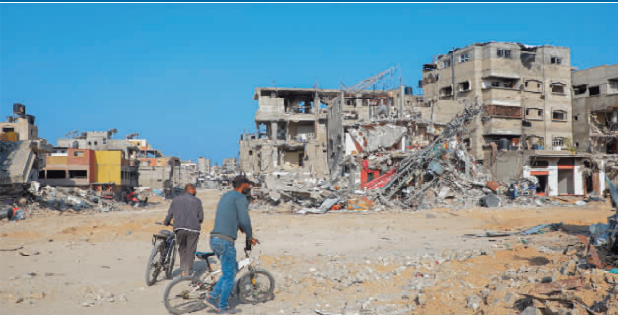
2月28日,人们经过加沙地带南部城市汗尤尼斯的建筑废墟。

世界卫生组织2月29日确认,去年10月7日新一轮巴以冲突爆发以来,以色列在加沙地带军事行动造成超过3万人死亡。本轮冲突爆发至今已有140余天,加沙地带人道主义危机持续恶化。如今,加沙民众最大“避难所”拉法恐遭以军地面进攻,停火谈判悬念重重。