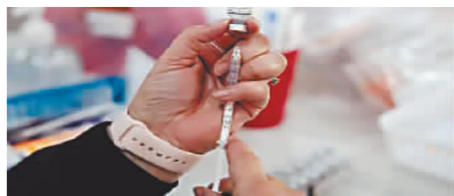
2022年1月9日,一名医务人员在美国得克萨斯州圣安东尼奥的诊所进行新冠疫苗接种准备工作。

新华社北京2月29日电 美国疾病控制和预防中心28日建议美国65岁以上人群今春接种一剂更新版新冠疫苗,作为每年一次的加强针。美疾控中心在一份声明中说,疾控中心免疫实践咨询委员会以11票赞成、1票反对的表决结果,认为老年人“应该”在今春接种新冠疫苗加强针。免疫实践咨询委员会去年只是建议65岁以上人群“可选择”接种一剂新冠疫苗加强针。路透社说,委员会这次建议的措辞重于去年。美疾控中心主任曼迪·科恩在声明中说,美国2023年新冠死亡和住院病例多为65岁以上人群。“对这些感染风险最高的人来说,在先前接种疫苗防护效力可能慢慢减弱的情况下,接种一剂加强针可以提供更多防护。”美疾控中心说,相比其他年龄段,65岁以上人群受新冠病毒影响尤其严重。去年10月至12月,超过一半新冠住院病例来自这个年龄段。美疾控中心估计,全美已有大约22%的成年人接种更新版新冠疫苗,其中近42%为65岁以上人群。