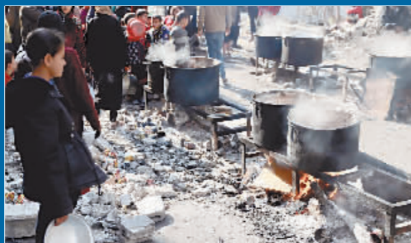
2月27日,在加沙地带一难民营,人们等待领取食物。