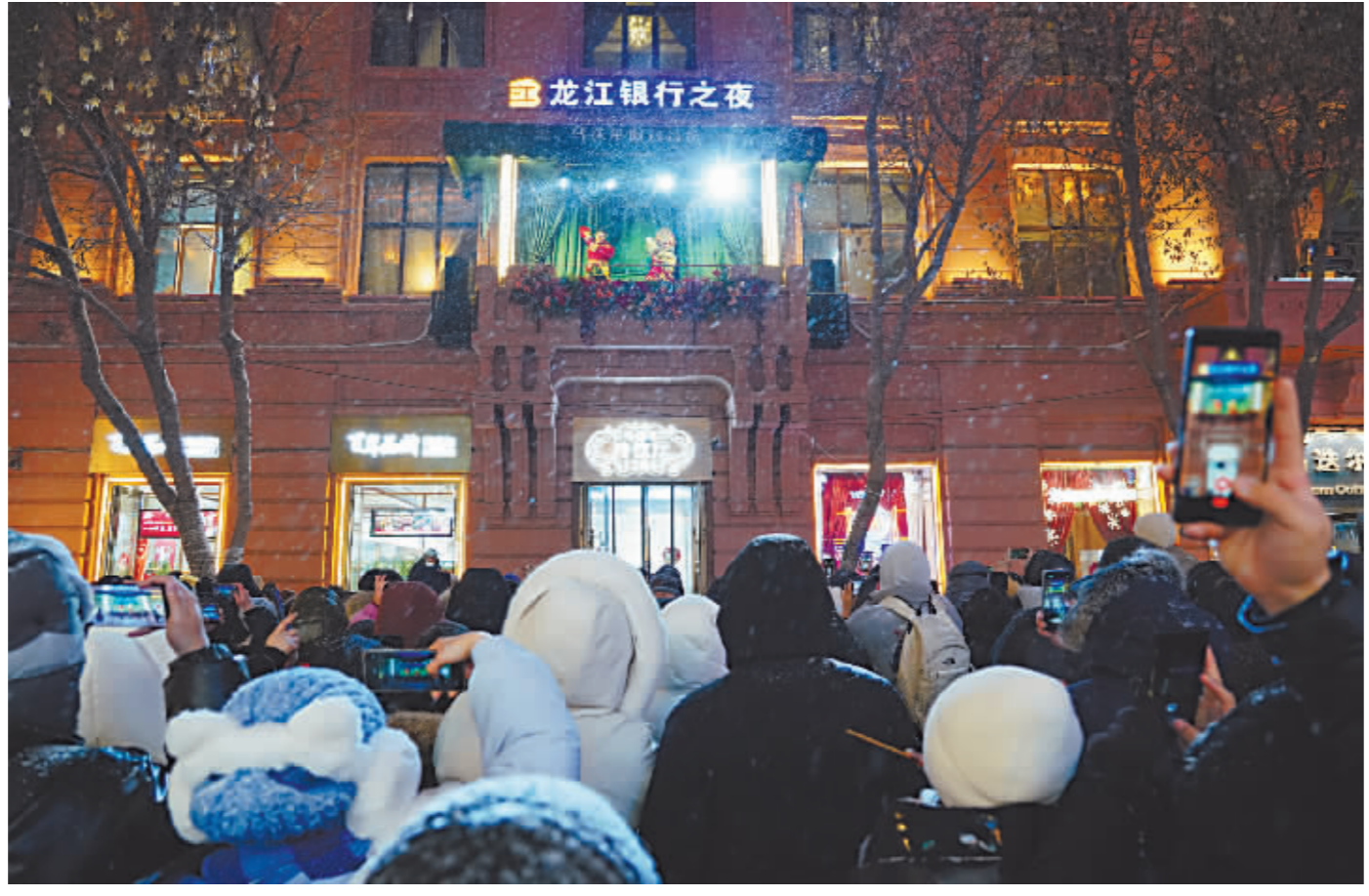
游客欣赏马迭尔阳台音乐会。

每年夏天中央大街上的一道亮丽风景。马迭尔宾馆这座百年建筑与音乐艺术的完美结合,令“音乐之城”深厚的音乐文化底蕴焕发出更加动人的乐章。2023年春节期间,马迭尔阳台音乐会首次尝试冬季演出。2023年12月25日,马迭尔阳台音乐会再次推出冰雪季演出。夜幕降临,伴随着飘扬的雪花,动人的乐曲流淌在青石铺路的百年老街上,与道路两旁矗立百年的建筑一起演绎着冰城独有的冬日故事与冰雪浪漫。这唯美浪漫的画面几乎刷爆了所有在这个冬季来到哈尔滨的世界各地游客们的朋友圈。每晚的演出时段,中央大街马迭尔宾馆阳台下都站满了游客,在举起手机拍下这美好画面的同时,人们也情不自禁地陶醉在动人的旋律里,随着音乐的节奏律动。