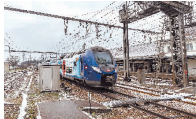
1月8日,列车驶入法国巴黎近郊的朗布埃火车站。

新华社北京2月28日电 存有今年巴黎奥运会安保方案的一部笔记本电脑和两枚U盘在法国一列火车上失窃。