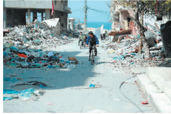
2月26日,人们路过加沙城的建筑废墟。

据新华社电 联合国机构官员27日警告,巴勒斯坦加沙地带目前至少四分之一人口濒临饥荒,若不及时采取相应行动,大范围饥荒“几乎不可避免”。